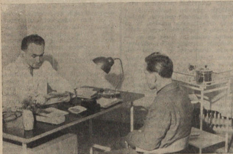
V komunalnem podjetju Javna skladišča je bila pred kratkim otvorena nova zdravstvena ambulanta, ki služi podjetju in bližnji okolici. Prostorji ambulante so moderno opremljeni; ambulanto pa pristejajo med najlepše v občini Moste. — Ambulanto je v celoti zgradilo podjetje Javna skladišča s svojimi sredstvi