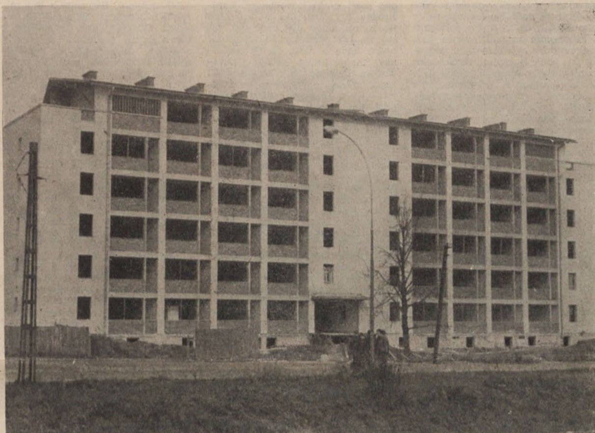
Moste se spreminjajo iz dneva v dan. Povsod nastajajo novi objekti in stanovanjske zgradbe

Težka so bila prva poveljna leta in v nekem smislu celo težja kot sam narodnoosvobodilni boj. Treba je bilo ne le obnoviti že pred vojno zaostalo in med vožno uničeno gospodarstvo temveč tudi odločno preiti na pot industrializacije in elektrifikacije, na pot hitrega tehničnega in ekonomskega napredka ter tako dvigniti deželo iz agrarno zaostale v industrijsko razvito. V tem pogledu so bili doseženi taki ogromni uspehi, kakršnih ob enakih pogojih v poveljni dobi ni dosegla nobena druga dežela.