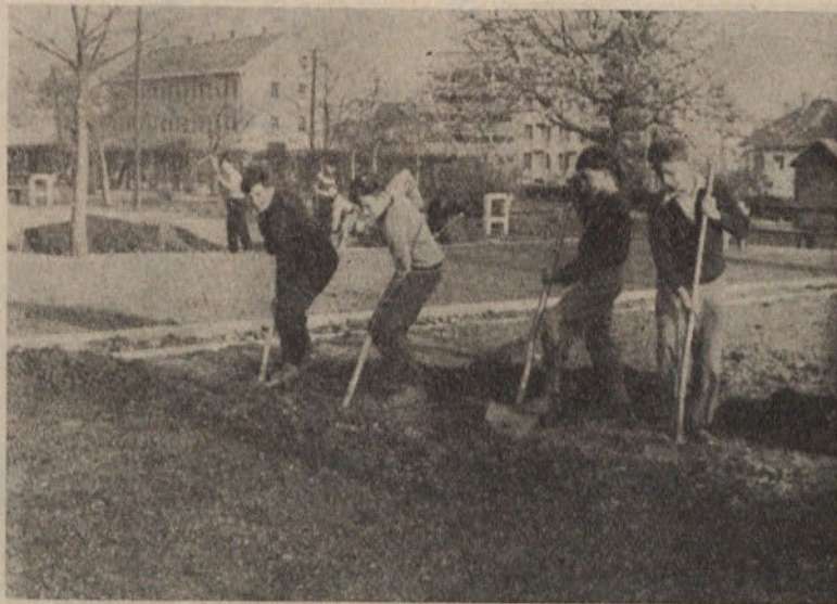
Mladi člani šolske zadruge pri delu na šolskem vrtu

Naša zadruga je vključena v tekmovanje z vsemi zadrugami v