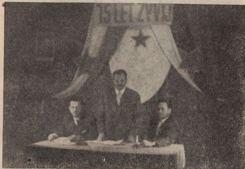
Posnetek s slavnostne seje občinske organizacije ZVVI