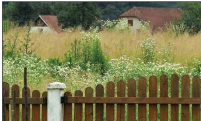
Marsikje je dva meseca deževalo skoraj vsak dan, zato še ni niti prvega odkosa.