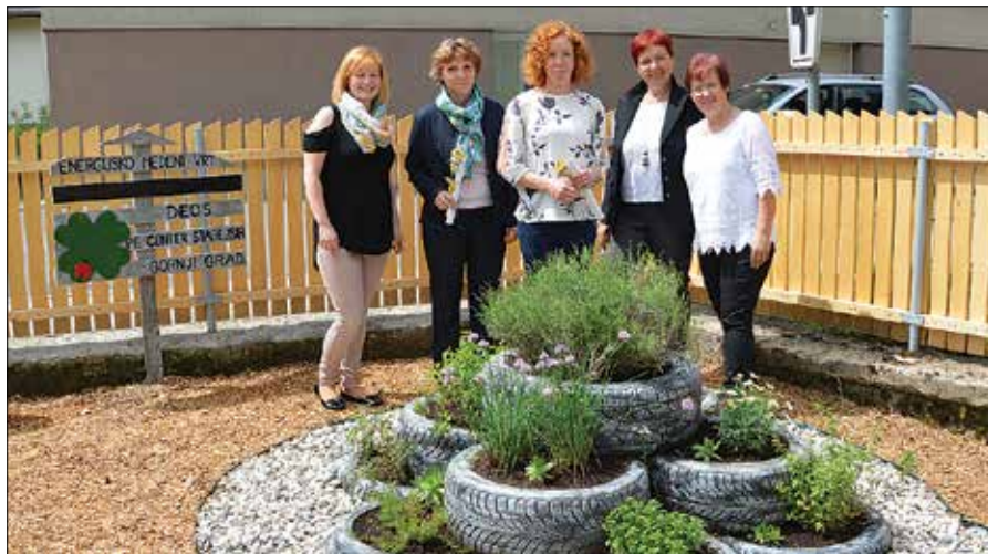
Vrt je namenjen vsem ljudem, da v njem posedijo in uživajo ali si natrgajo zelišč za čaj.