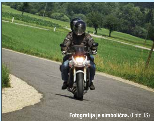
Fotografija je simbolična.

Rovt pod Menino: 15. junija v popoldanskem času je na cesti iz smeri Rovta pod Menino proti Lipi padel motorist, državljan Španije. Sopot-