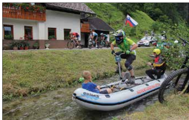
V Lučah so se ob dirki lotili posebnega izziva: kako s starim sobnim kolesom na raftu prehiteti kolesarsko karavano.

Med mladimi kolesarji se je več kot odlično odrezal tudi Mozirjan