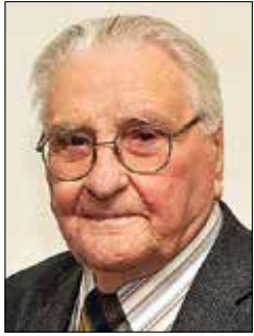
Iz zapisov Aleksandra Videčnika