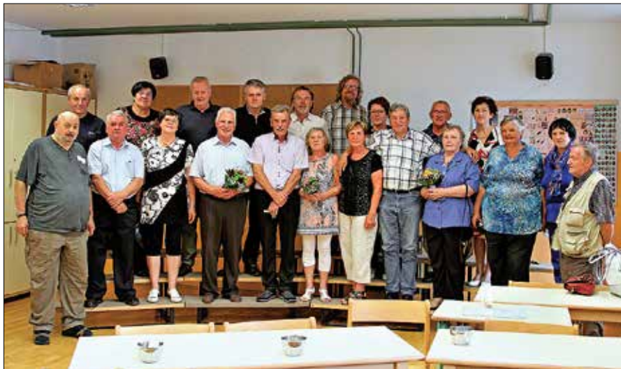
Nekdanji sošolci in učitelji OŠ Blaža Arniča Luče po 50 letih