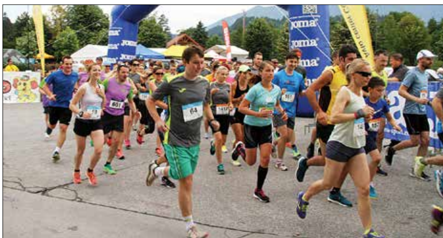
Preko 350 tekačev se je skupaj zapodilo pod startnim obokom.