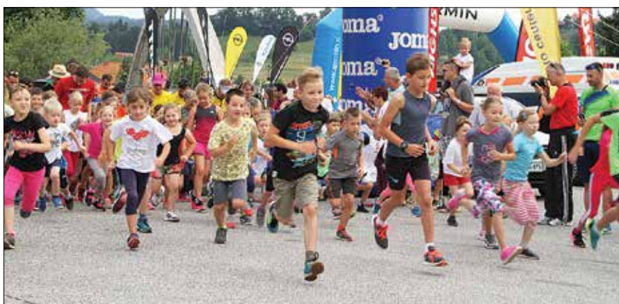
Otroci so Bimbo tek vzeli nadvse resno in se z vso vneto zagnali s starta.