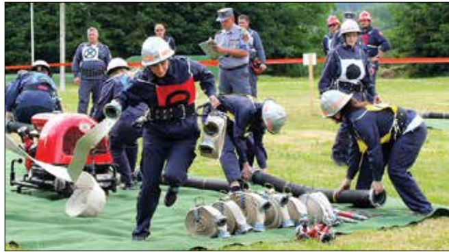
Na gasilskem tekmovanju je sodelovala tudi domača ženska desetina iz PGD Gorica ob Dreti.

Člani Prostovoljnega gasilskega društva Gorica ob Dreti so 2. junija pripravili 28. turnir za kip sv. Florjana za desetine članic in članov. Gasilci in gasilke so se v športno rekreacijskem centru na Lazah pomerili v suhi vaji z motorno brizgalno. Na njem je sodelovalo devet moških in celo dvanajst ženskih ekip, kar je največ, odkar prirejajo tekmovanje. Vsaka ekipa je opravila dve vaji zapored, štela pa se je tista, ki je bila boljše izvedena.