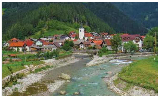
Med »TOP 30« turističnimi destinacijami zaseda občina Luče 15. mesto, najvišje med zgornjesavinjskimi občinami.

Turisti so malo vasico Solčava obiskovali že dve stoletji nazaj,