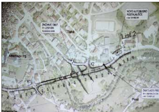
Poleg obvoznice bo narejena rekonstrukcija Kocbekove ceste od nekdanjega podjetja Smreka do osnovne šole.