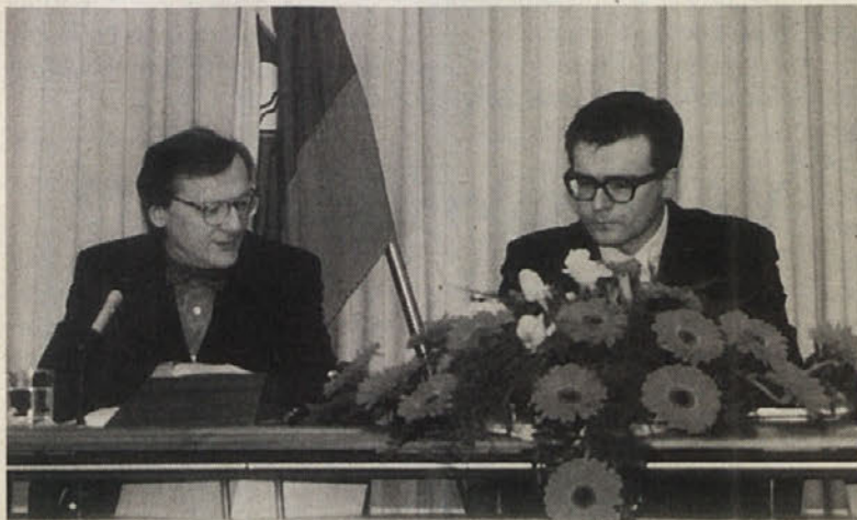
Zadovoljna z razvojem meddržavnih odnosov: avstrijski in slovenski zunanji minister, dr. Wolfgang Schüssel in Zoran Thaler

Kako zainteresirana je Avstrija za plodno in prijateljsko sodelovanje s Slovenijo, potrjuje ena prvih poti v tujino avstrijskega podkanclerja in zunanjega ministra Wolfganga Schüssla. Ta je pretekli petek uradno in delovno obiskal Ljubljano, poleg razgovorov s slovenskim zunanjim ministrom Zoranom Thalerjem pa je opravil še vrsto srečanj z najvišjimi predstavniki slovenskih oblasti. Sprejeli so ga ljubljanski župan Dimitrij Rupel, premier Janez Drnovšek, predsednik Milan Kučan, ljubljanski nadškof in metropolit Alojzij Šuštar, srečal pa se je tudi s slovenskim strankarskim kolegom Lojzeto Peterletom.