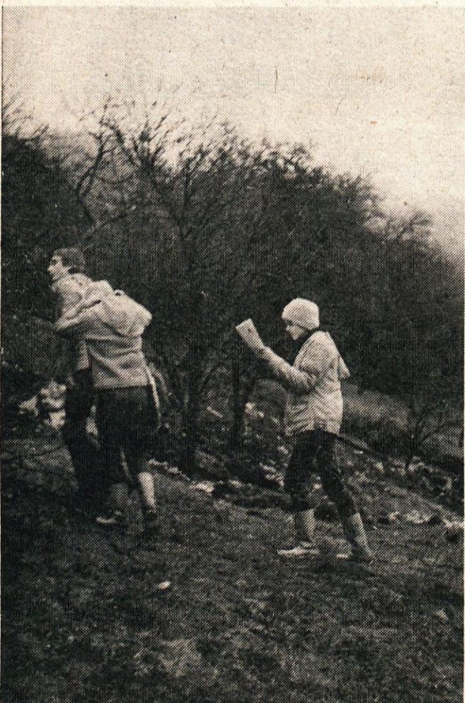
V splošni ljudski odpor se vključujejo tudi mladi