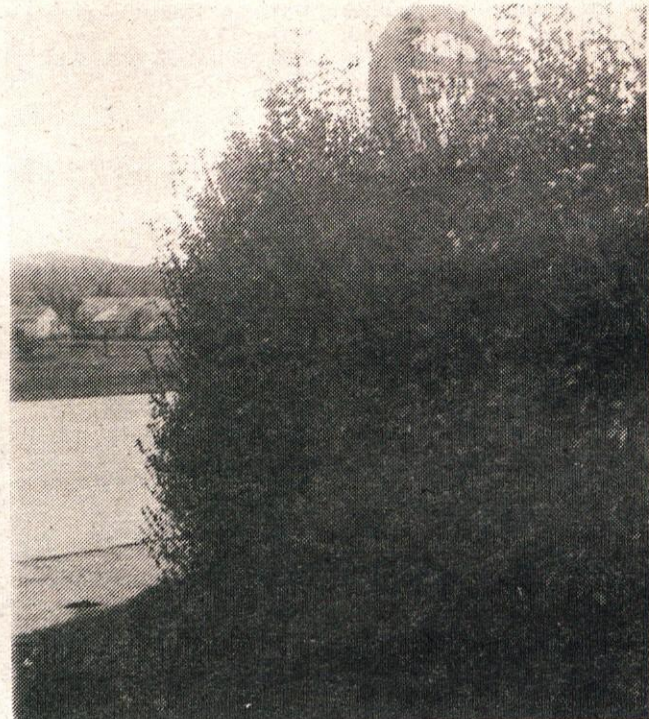
Ne smemo dopustiti, da bodo tudi letos žive meje prerasle in zakrile prometne znake.