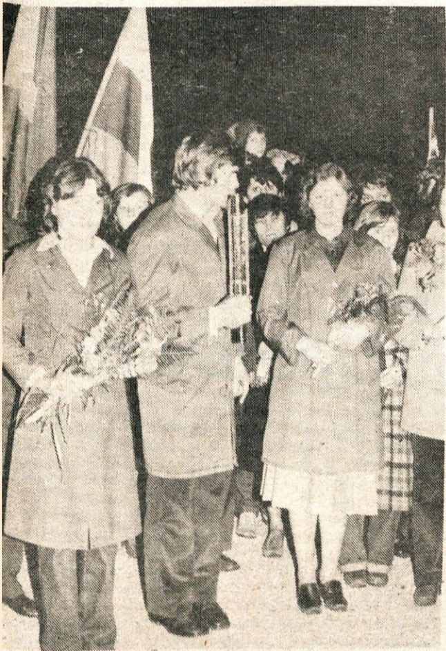
Svečan sprejem nosilcev štafetne palice je bil tudi pred Titanom, kjer je štafeta prenočila.

● Ob (ne)uresničevanju razvojnih programov v gospodarstvu