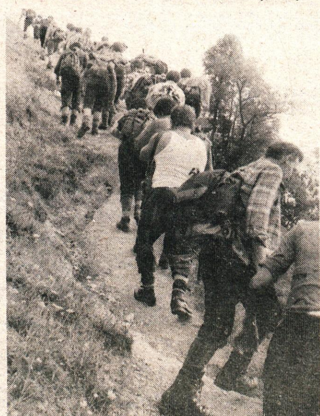
Izlet članov planinske sekcije KIK na Raduho.

Vsem, ki ste čakali, da se bodo pojavili plakati, ki bi vas vabili na ta izlet, se najprej opravičujem.