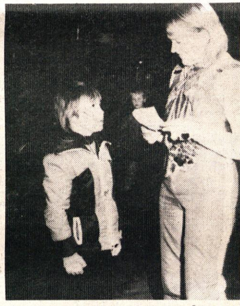
In zdaj je na vrsti najpomembnejše. Čestitke in priznanja za uspešno smučanje.