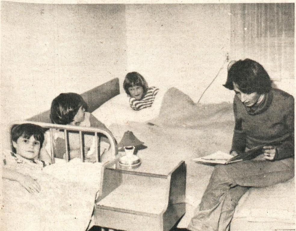
Tovarišica bere pravljico za lahko noč. Tudi večeri so bili lepši kot doma.