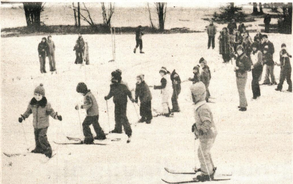
Drug za drugim v ravni vrsti zdaj gremo na tekmovanje!