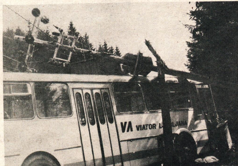
Ob cesti Stahovica-Kamniška Bistrica so morali nadomestiti polomljen električni drog, ki ga je prelomil Viatorjev avtobus.