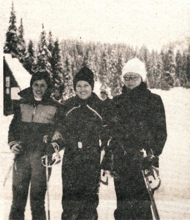
Ženska ekipa SO Kamnik

KAMNIŠKI OBČAN glasilo SZDL občine KAMNIK – Ureja uredniški odbor – glavni in odgovorni urednik MIRA JANČAR – tehnični urednik FRANC MIHEVC – Izhaja enkrat mesečno – Uredništvo in uprava – Kamnik, Japljeva 6, telefon 831-124 – tekoči račun 50140-678-57156 – Rokopisov in fotografij ne vračamo – Tiska ČGP Delo v Ljubljani.