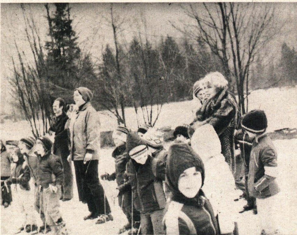
Tekmovanje so si prišli ogledat tudi nekateri starši. Prav gotovo so imeli večjo tremo kot tekmovalci.