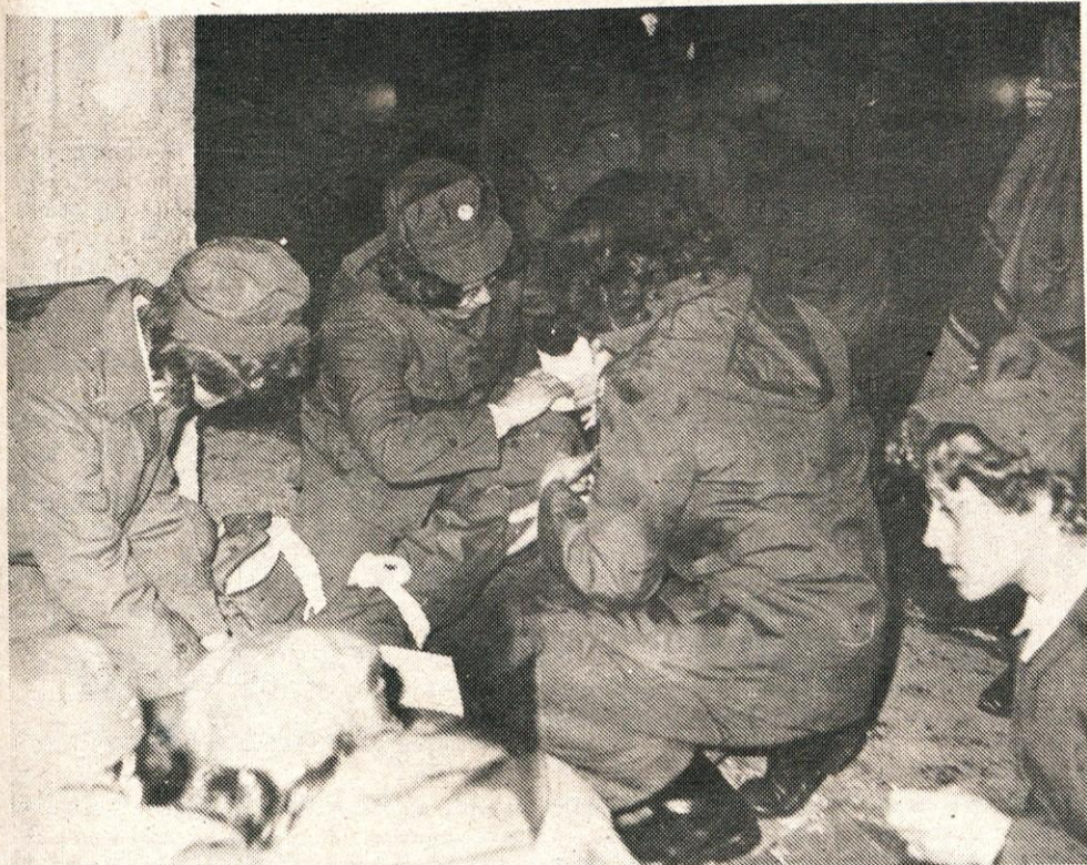
Ženske roke so bile pri vajah civilne zaščite zelo spretno.