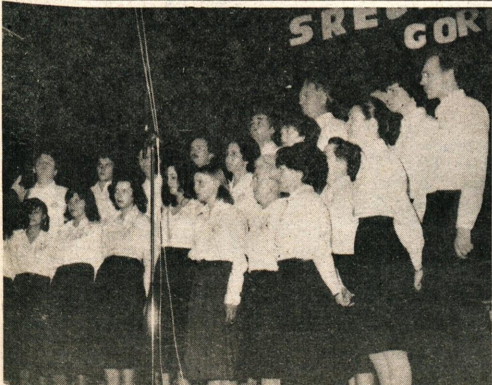
Na srečanju gorenjskih pevskih zborov, ki je bilo 30. marca, v kulturnem domu v Mengšu, so poslušalci še posebno prisrčno pozdravili mešani pevski zbor Gorjanci iz Kotmare vasi na Koroškem.

Ob 105-letnici rojstva znanega pesnika in borca za severno mejo pokojnega Rudolfa Maistra, kamniškega rojaka, je bila 29. marca ob 12. uri ob spomeniku na Trgu talcev krajša slovesnost. Predstavniki družbenopolitičnih organizacij in občinske skupščine Kamnik so se oddolžili spominu na velikega revolucionarja in rodobljuba s položitvijo venca k njegovemu spomeniku.