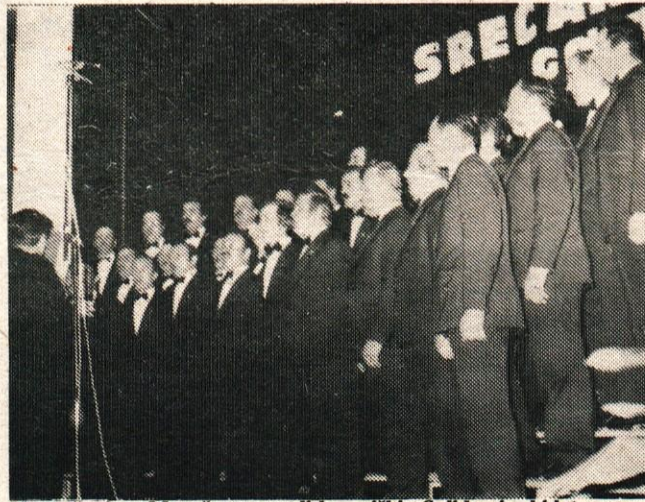
Na srečanju v Mengšu so zapeli kamniški »Solidarci«, ki letos praznujejo 60-letnico ustanovitve.

spodbud amaterskim pevskim zborom. Takega mnenja so bili tudi predstavniki Zveze kulturnih organizacij Gorenjske, ki so konec marca organizirali srečanja gorenjskih pevskih zborov v kulturnem domu v Mengšu.