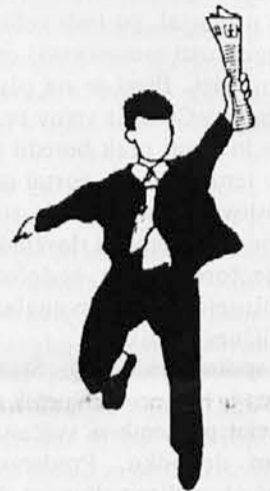
Beri Katoliški glas