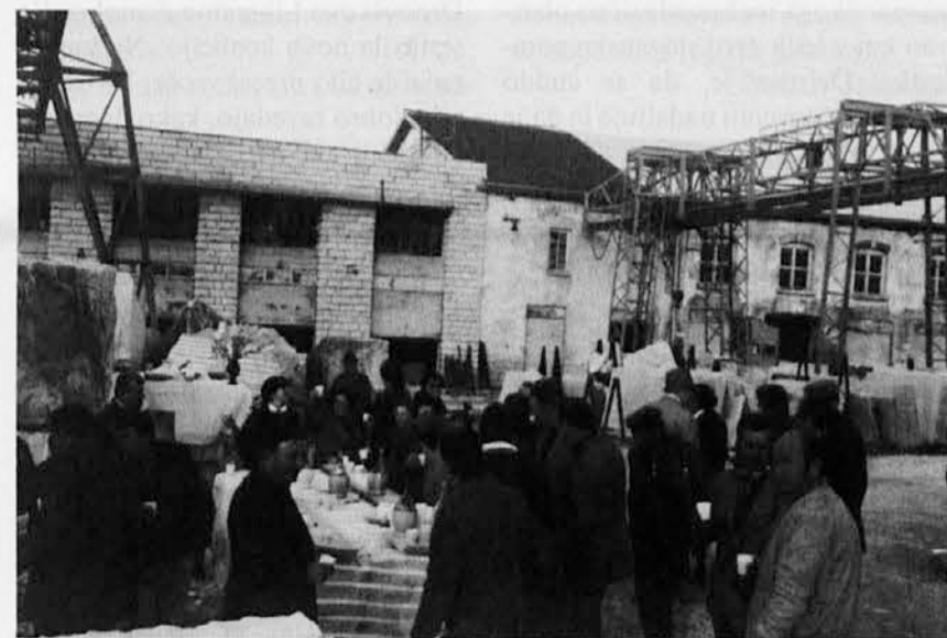
Družabnost po maši v nabrežinskem kamnolomu

Zakonodaja bi morala družino ščititi. Brez zdravih družin ni zdrave družbe. 1. maj ne sme mimo, ne da bi pomislili na vse te probleme. Lep izlet in boljše kosilo imamo lahko tudi druge dni.