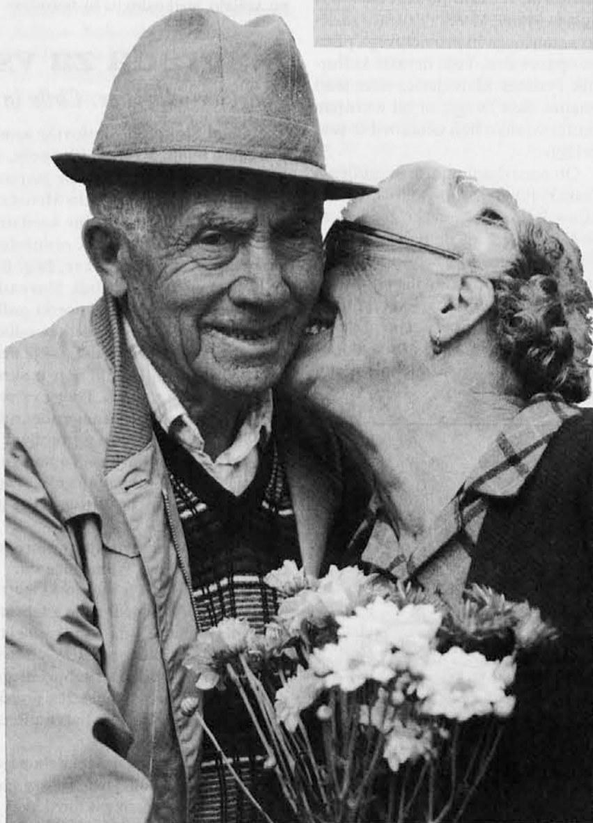
Koliko dela je zapisanega na najinih obrazih... Človeška toplina, nepričakovan obisk, izraz bližine, naju lahko iskreno osrečijo.

mi, prebivalci Severa, predstavljamo 22% prebivalcev na zemlji in razpolagamo z 80% bogastva zemlje, medtem ko Jug sveta, ki zajema 78% prebivalstva zemlje, razpolaga z ostalim 20% bogastva.