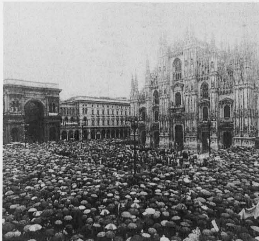
Osrednja proslava je bila v Milanu. Izzvenela je kot opomin in opozorilo na pretekle zmote in kot poziv h grajenju realnega zgodovinskega spomina, ki je jamstvo za mirno bodočnost narodov.

sconijske kandidature za bodočega premiera, ki jo praktično ima že v rokah. Opozicija — in celo nekateri krogi Severne lige — menijo, da televizijski mogotec ne more upravičeno segati po predsedstvu vlade, ker ima preveč zasebnih interesov, ki bi se lahko križali z državnimi oziroma zato, ker bi lahko upravo vodil tako, da bi koristil predvsem svojim podjetjem, ki jih ima brez števila (se nadaljuje na 4. strani)