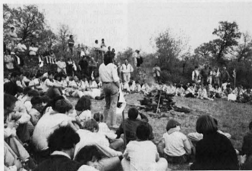
Prizor iz prejšnjih let