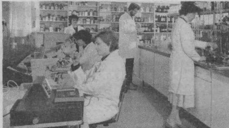
V Medexu hitro ugodijo željam tujih naročnikov. Žal pa imajo pogosto težave z embalažo in drugim materialom, ki ga potrebujejo za celovito izpolnitev naročila