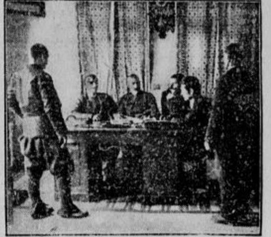
KOMITASKI PREKI SOD.

Pod turško oblastjo je to vodstvo pomenjalo državo v državi s lastnimi oblastmi in lastno diplomacijo; imelo je za seboj velik del prebivalstva. Kako močna je bila te-