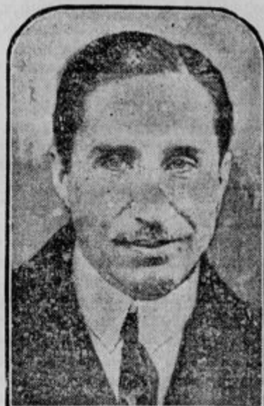
M. Yanguas, predsednik španskega parlamenta.

je in Jugoslavije na drugi strani, da bi se med temi državami dosegel sporazum. Francoska vlada se zvesto drži podpisanih pogodb ter je pripravljena, v smislu okvirne note k trianonski pogodbi v tej stvari storiti korake z namenom, da se odstranijo vzroki sovražnosti v splošno zadovoljstvo interesiranih strank, ter pod pogoji, ki jih navaja okvirna nota, odpravijo gotove gospodarske etnografske krivice, kakor tudi da se popolnijo že veljavne določbe v varstvo manjšin. Posebno