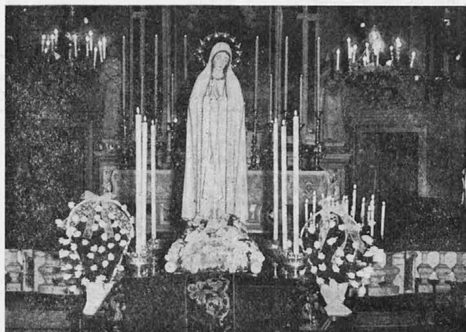
KIP FATIMSKE MATERE BOŽJE NA OPCINAH