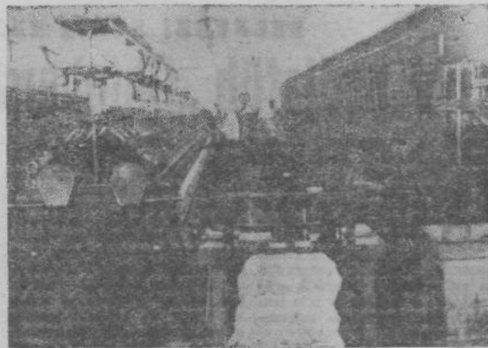
Pogled v moderno tovarno.

Brez »Naše skupnosti«, glasila Predsedstva Zveznega odbora SZDL Jugoslavije, ne more biti KVALITETNEGA SODELOVANJA IN ODLOČANJA v organih družbenega upravljanja