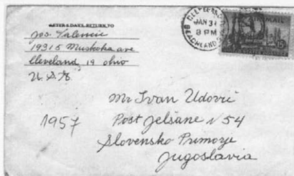
Slika 6: Ovojnica pisma iz leta 1957

Boljša bodočnost se je kljub hitremu napredku, o katerem bere Tone v daljni Argentini, približevala zelo počasi, prepočasi za sorodnike v Jelšanah, izčrpane zaradi fašizma in vojne. Kljub paketom, ki prihajajo iz Amerike, in denarju, ki ga pošiljajo na različne načine, včasih prek potovalne agencije Kollander iz Clevelanda ali »banke«, včasih prek rojakov, ki iz Ar-