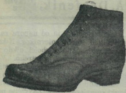
Moški črni boks Din 250.—