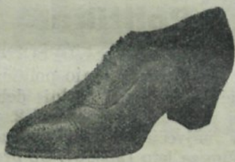
Boks, moderna fazona Din 220.—