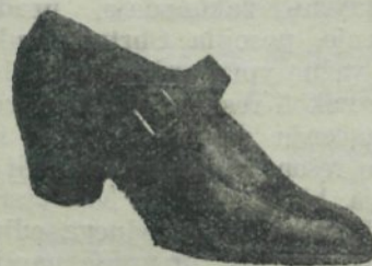
Boks, črni . . . Din 210.— rjavi . . . Din 240.—