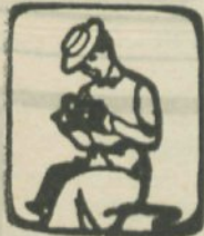
V. u. f. Hof-Manufaktur für Photographie. Fabrik photogr. Appar. Photogr. Utensilien.