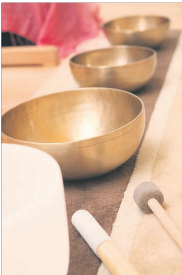
Poleg gonga so nepogrešljive tudi tibetanske pojoče skleda. Njihov zven bolj občutiš kot slišiš, ko ti jih položijo na telo.

Sredi toplo opremljene sobe seveda kraljuje gong. Videti je kot ogromen kovinski pokrov, ki ga je nekdo obesil na leseno stojalo. Približno 30 kilogramov ni enostavnih za transport, vendar Špela – predvsem po moževi zaslugi – običajno spremlja povsod. Ob gongu so seveda nepogrešljive še tibetanske pojoče posode in razni zvončki. Glede na to, da je tudi uvoznica in zastopnica za tovrstna glasbila, gre skozi njene roke veliko različnih izdelkov. Zadnja pridobitev, lastnici še posebej ljuba, je kristalna skleda. »Najprej se mi je zdelo, da je bila zgrešena naložba. Sčasoma pa sem spoznala njen neverjeten učinek. Za mnoge je kar malo prehuda. Meni pa se dogajajo neverjetne reči, odkar igram nanjo.« In res. Ko udari ob zunanji rob posode, ki bi prav lahko bila kakšna kuhinjska »namestitev« za solato, si najprej presenečen, da stvar sploh zveni. Ko pa je z istim tolkalom začela vleči po zunanjem robu, je zvok zavibriral in se dvignil do neslutnih razsežnosti. Kot bi ji uspelo v roke prijeto neoprijemljivo materijo in se z njo po mili volji igrati. Zvok pa se naseli v možgane in zelo kmalu ni tam prav nobene misli več. V