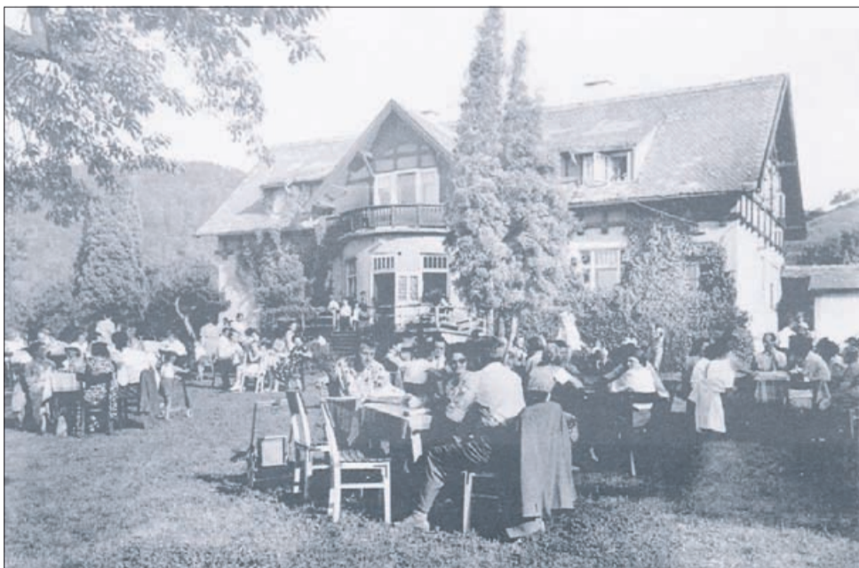
Priljubljen cilj sprehajalcev je bila tudi gostilna na Petričku; razglednica je nastala med obema vojnama.