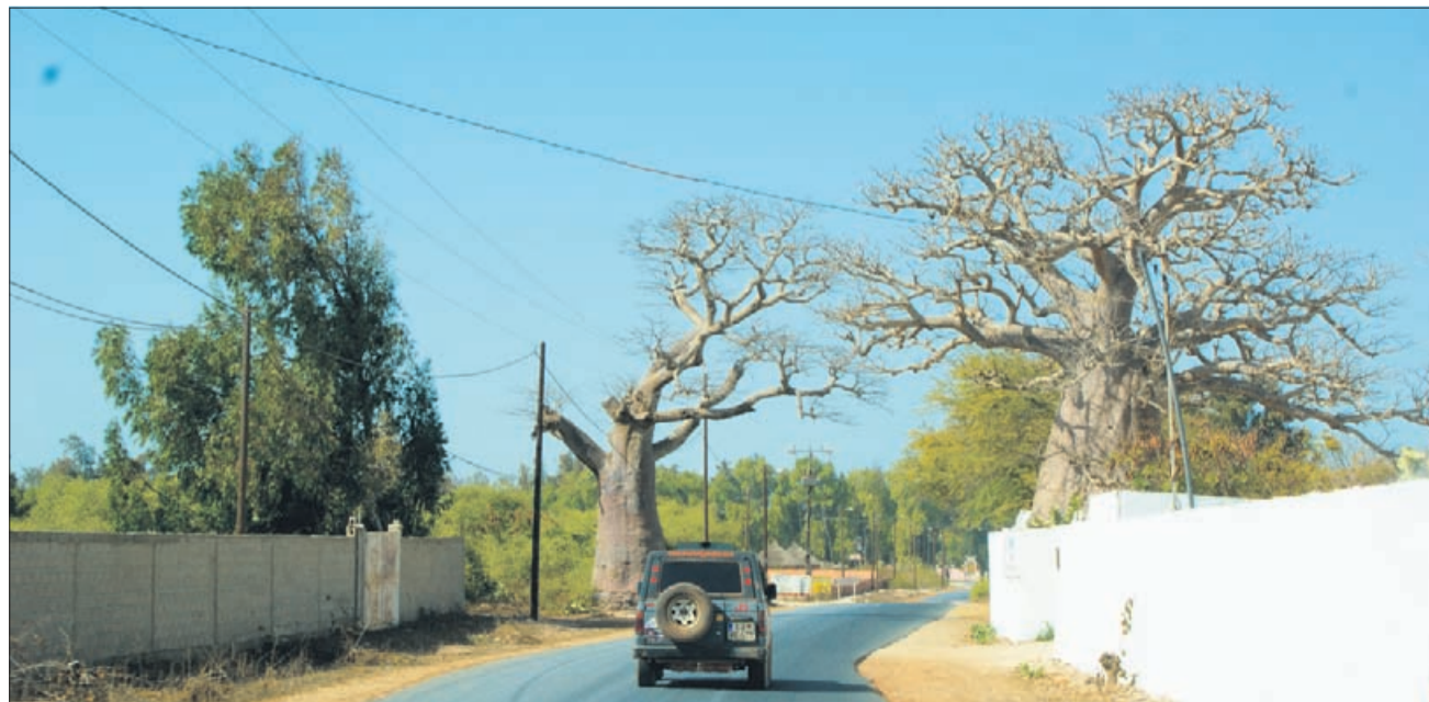
V Senegalu je baobab sveto drevo in se ne umakne niti cesti.