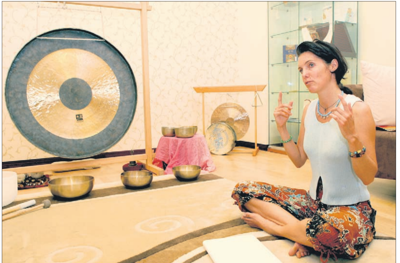
Zvok gonga je vedno terapija. Tako za stranke kot zame. Zelo redki so tisti, ki jim niti to ni pomagalo, da bi se resnično sprostiti.