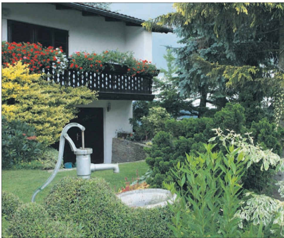
Hiša na skrajnem robu slivniške planote je bila grajena v 70. letih prejšnjega stoletja. Z veliko angažmaja lastnikov še danes deluje moderno. Vrt okrog nje pa je tisto, kar jo dela nezamenljivo.