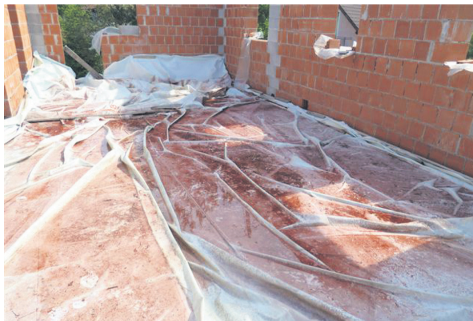
Rdeča snov, ki so jo našli v Marija Dobju in jo analizirali v dveh ustanovah. V njej naj bi bile tako težke kovine kot posebne alge, ki so jo obarvale rdeče. Cinkarna trdi, da to ni posledica njenih emisij, borci za čisto okolje pa temu ne verjamejo.

civilnih iniciativ, se preiskavi ne izključujeta, temveč dopolnjujeta. »Inštitut je opravil raziskavo s ciljem, da določi žive organizme, naš cilj pa je bil določiti vsebnost težkih kovin v rdeči snovi. Mi smo koncentracije težkih kovin zaznali in ko smo jih primerjali s koncentracijami, ki so dovoljene v zemlji, so bile te zelo primerljive,« pravi Planinšek in dodaja, da v Celju obstaja določena količina sedimenta, ki vsebuje težke kovine, med njimi kadmij, svinec titan, zato ne preseneča, da so našli določene koncentracije tudi v omenjenem vzorcu. »Titan lahko povežemo z emisijami iz cinkarne, ne moremo pa trditi, da gre za sadro z deponije,« dodaja. Tudi sami so s sežigom opravili analizo prisotnosti organskih snovi v vzorcu, saj je bilo železa v njem premalo, da bi ga obarval rdeče. Polovica vzorca je zgorela, kar je lahko znak za organsko snov. »Analiza inštituta pa je dejansko doka-