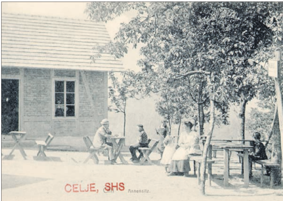
Senčni gostilniški vrt na Anskem vrhu. Fotografija je iz časa pred 1. svetovno vojno.