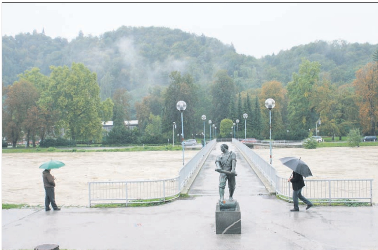
Poplave, september 2010: šlo je za las. Splavarski most bi v primeru večjega pretoka povzročil precejšnje posledice, eden od protipoplavnih ukrepov bo zato tudi nadomestitev z novo brvjo.

Veliko napak je bilo storjenih tudi v Savinjski dolini, kjer se je pozidalo veliko razlivnih površin. Zaradi naselij so se na Savinji delale regulacije in posledično je vse več vode prehajalo skozi Celje. Seveda težava