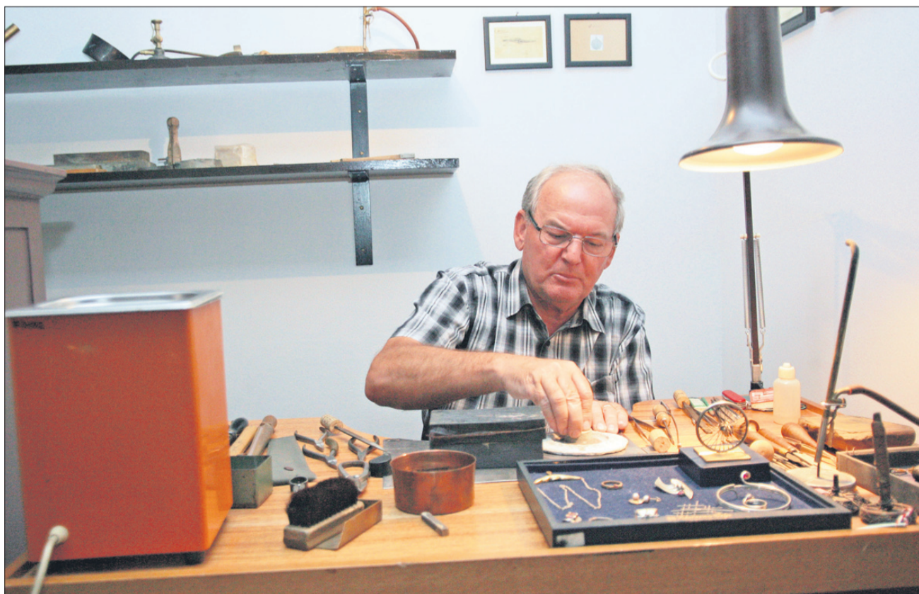
Pred začetkom dela – na alpaki, zlitini niklja, bakra in cinka, ki je zelo podobna belemu zlatu, se učijo zlatarji vse Evrope, na njej se ne more narediti veliko škode, ker je poceni.