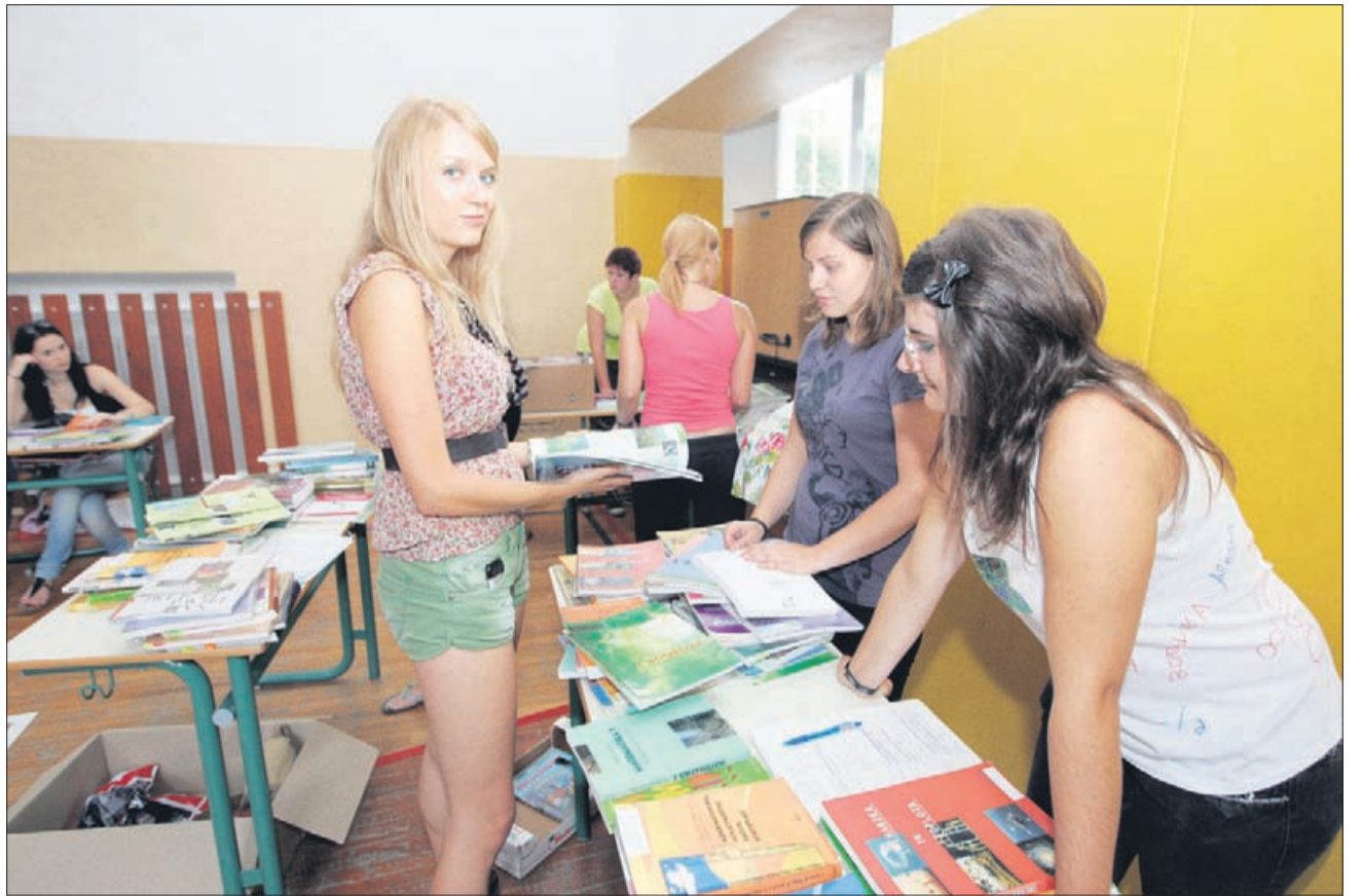
Počitnice so čas, ko dijaki in študenti urejajo tudi vse potrebno za pridobitev štipendije. V nekaterih šolah, tudi v I. gimnaziji v Celju, pa zaključek in začetek šolskega leta izkoristijo za sejme rabljenih učbenikov.

V tem šolskem oziroma študijskem letu prejema državne štipendije 42.923 dijakov in študentov, od tega je bilo maja 16.262 mladoletnih dijakov. Sredi prejšnjega tedna sta bila objavljena poziva za državne in Zoisove štipendije v prihodnjem letu. V centrih za socialno delo sprejemajo vloge dijakov za državne štipendije do 7. septembra, študentov pa do 7. oktobra. Enaka datuma veljata tudi za Zoisove štipendije, le da je vloge treba poslati na Javni sklad RS za razvoj