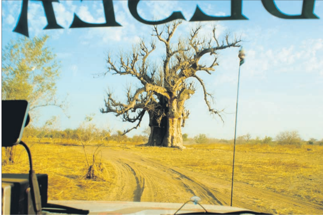
Baobab kot orientacijska točka v malijski savani

Baobab raste v suhih predelih afriške savane, kjer se izmenjujejo deževna in daljša sušna obdobja. Deblo drevesa je spužvasto, s posebnim lubjem, ki se obnavlja. Drevo lahko shranjuje tudi več tisoč litrov vode. Poleg tega je negorljivo, kar dodatno pripomore k odpornosti proti požarom. V deževni dobi drevo za tri mesece ozeleni in tudi cveti. Iz cvetov, ki so velik, rumene barve in cvetijo le en dan, se