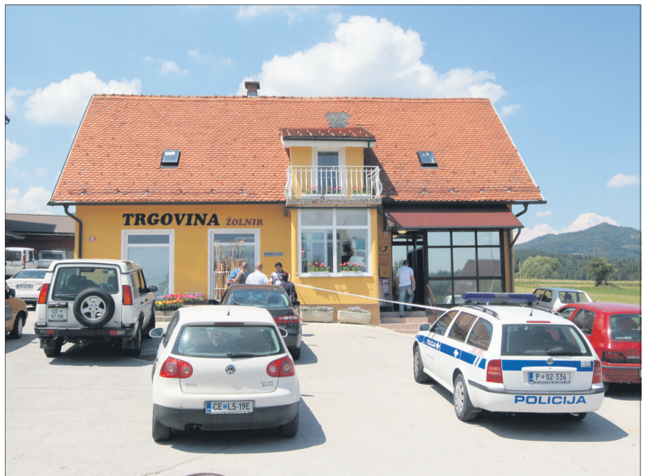
Pošta v Šmartnem v Rožni dolini je bila na udaru konec maja. Na srečo je zaradi ropa nastala zgolj manjša materialna škoda, roparja pa je policija že izsledila.

Pošta Kresnice so roparji napadli že v letih 2004 in 2009. Oba omenjena ropa sta se končala brez telesnih poškodb uslužbencev in zgolj z manjšo materialno škodo. Glede na tragični dogodek bo Pošta Kresnice do nadaljnjega zaprta.