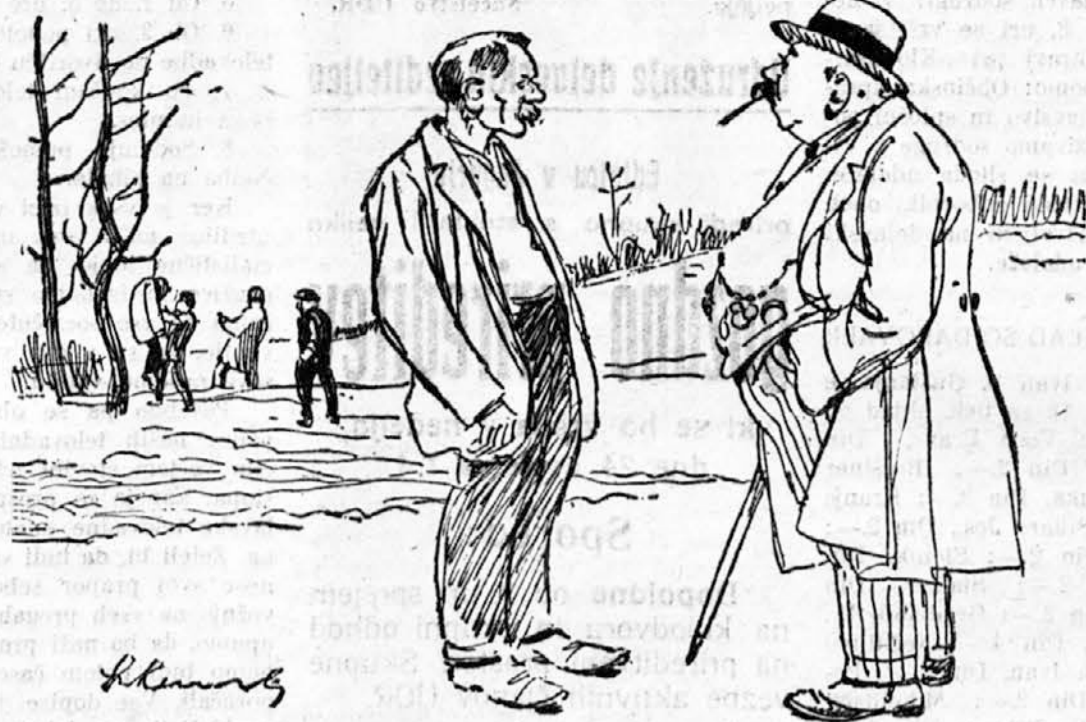
Delavec: Ženo in šest otrok je zapustil — beda ga je pognala v smrt! Kapitalist: Prav mu je! Zakaj pa je delal samo po osem ur na dan!