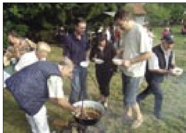
S porabskoga kotla je brž sfalijo divjačinski golaž

turistično izletniški gazdiji »Pri starom kovači« na Sp. Slemenu v občini Selnica ob Dravi. Na tekmovanje se je