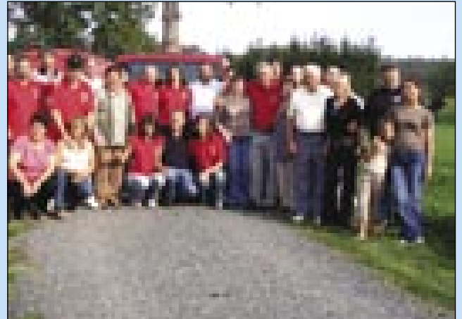
Gostje in gostitelji v Sakalovcih

V soboto, 30. septembra, so prostovoljni gasilci iz Dobrne obiskali svoje kolege v Sakalovcih. Lansko leto jih je nekaj članov Prostovoljnega gasilskega društva Sakalovci obiskalo na Dobrni in tam smo se dogovorili, da se bomo vsako leto dobili, enkrat pri njih na Dobrni, enkrat pa pri nas v Sakalovcih. Pred njihovim prihodom je bilo že vse organizirano, pripravili smo jim celodnevni program. Od našega društva nas je bilo šest, ki smo jih čakali zjutraj ob pol desetih na mejnem prehodu na Verici. Od njih je prišlo sedem gasilcev, štirje moški in tri