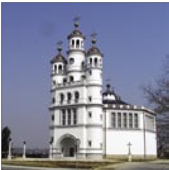
Cerkev sv. Trojstva v Odrančaj z jugovzhodne strani

zazidati stanovanjski blok, zatok pa so leko kesnej postavli nauvo. Samo ka je tau nej šlo tak glatko. Prizadejvanja za