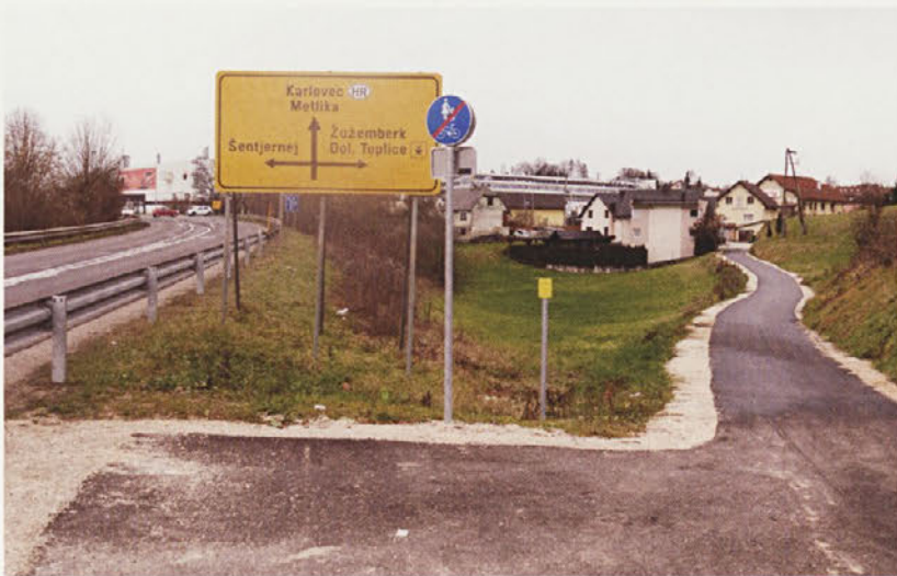
Začasna navezava večnamenske poti na Kandijsko cesto nima osvetlitve, zato je ponoči v temi.

stalna ovira, od katere je treba zagotoviti odmik kolesarske površine, kar mešana površina za pešce in kolesarje zagotovo je. 8 Po naravi stvari se ta (splošen) odmik nanaša na vse vrste kolesarskih površin in na različne objekte, razen če je v posameznih določbah predpisan specialen odmik. 9