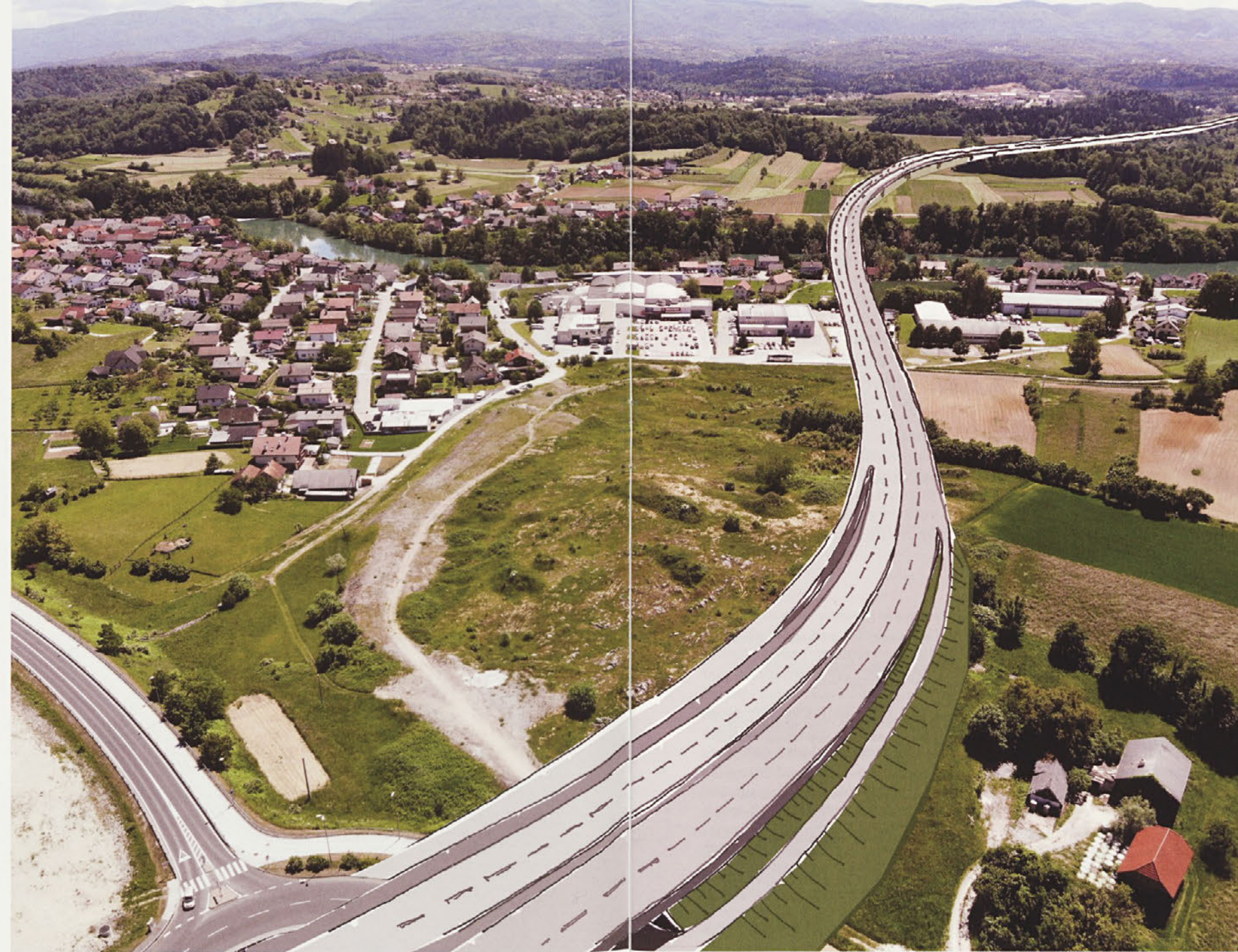
Potek t. i. tretje razvojne osi skozi naselje Ločna-Mačkovec. Na tem mestu je bila z občinskim prostorskim načrtom sicer predvidena vzhodna obvoznica z drevoredom, ločenimi kolesarskimi in pešpotmi ter priključkom za poslovno cono Mačkovec. Zdaj pa bo dobesedno nad glavami krajanov tekla plačljiva hitra štiripasovnica za regijski in evropski tranzit, po kateri bo na dan vozilo 20 000 težkih tovornih vozil.

Hkrati pa je ARSO pozval, da udeležbo v postopek priglasijo tudi tiste osebe oziroma lastniki nepremičnin, ki niso prikazani v območju vplivov v PVO, pa kljub temu menijo, da bodo vplivi gradnje in uporabe ceste posegali tudi v njihove pravice in pravne koristi. Te osebe bi morale v primeru priglasitve udeležbe v svoji vlogi navesti, v čem je njihov pravni interes, zaželeni (ne pa obvezni!) pa so tudi dokazi o navedenem.