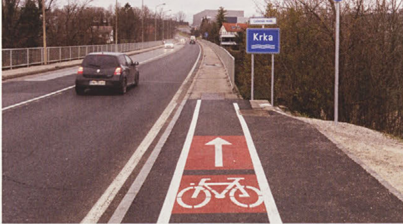
Mešane površine za pešce in kolesarje na Ločenskem mostu so neustrezne in nevarne, sploh ker so pločniki, po katerih potekajo, preozki in dotrajani.