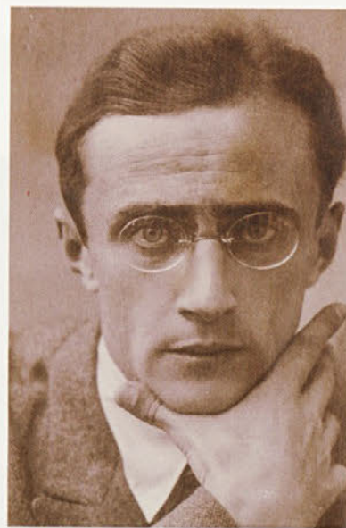
Pisatelj in dramatik Slavko Grum v dvajsetih letih 20. stoletja, ko je bil na vrhuncu svojih ustvarjalnih moči.