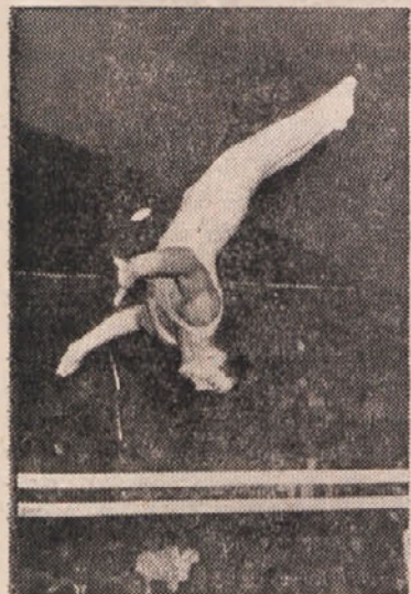
Trikrat svetovni prvak Miro Cerar