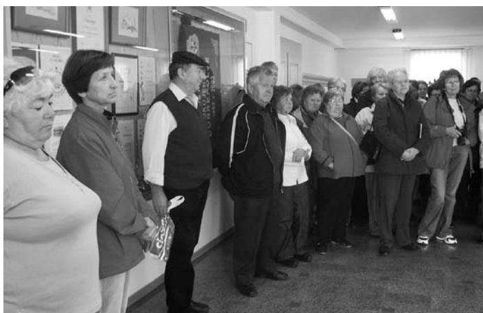
Naši prijatelji iz Šmarja-Sap