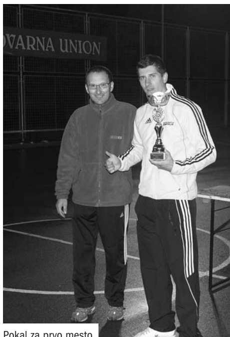
Pokal za prvo mesto