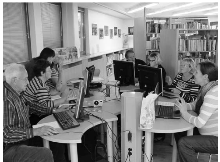
Projekt Simbioz@ - mladi učimo starejše računalništva