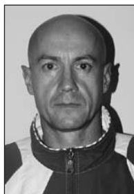
Piše: Zdravko Marič , dr.med.