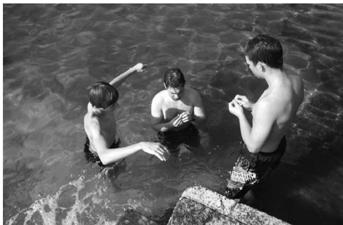
Fantje so našli nov hobi - lovljenje rakovic