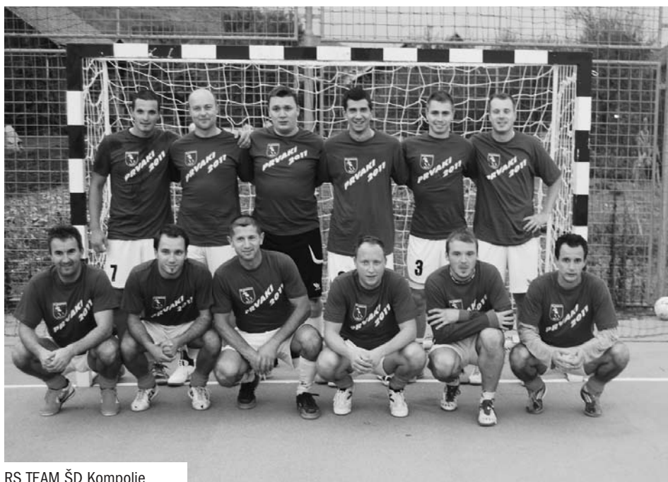
RS TEAM ŠD Kompolje

mi naslov ekipe, ki nastopa pod okriljem ŠD KOMPOLJE.