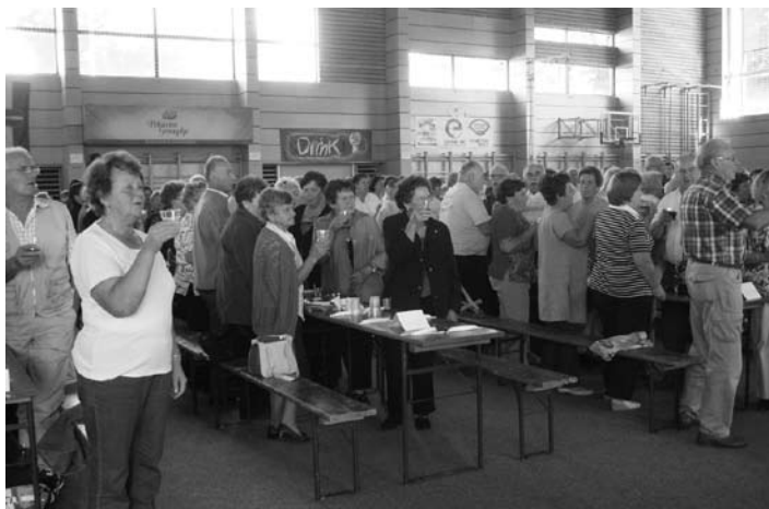
Za začetek »kolk'r kapljic, tolko let«, za konec pa »kje so tiste stezice, ki so včasih bile, ki peljejo do doma, kjer so mam'ca doma«

Naj še enkrat spomnim: NE BODI SAM, PRIDRUŽI SE NAM!! ♦