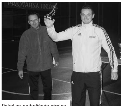
Pokal za najboljšega strelca

Že po nekaj uvodnih jesenskih krogih so iz omenjene šesterice odpadle štiri ekipe, tako da sta v boju za osvojitev prvenstva ostali samo še ekipi PRO2 SNOOPY TEAM in RS TEAM ŠD KOMPOLJE. Slednja si je krog pred koncem priigrala štiri točke prednosti in s tem svoj prvi naslov prvaka lige, oziroma sed-