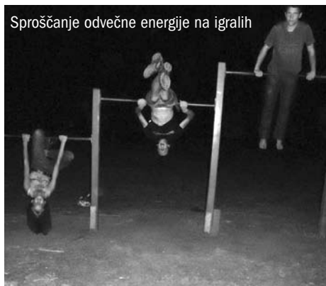
Sproščanje odvečne energije na igralih

Ta vikend, preživet na morju, je bil za vse nas, ki smo bili tam, izredno zabaven in nepozaben. Čeprav smo bili tam samo tri dni, smo jih res izkoristili in jih preživeli kar se da dobro. ♦