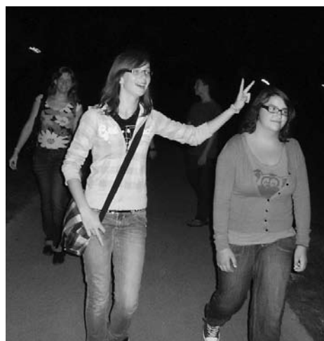
Sprehod do mesta