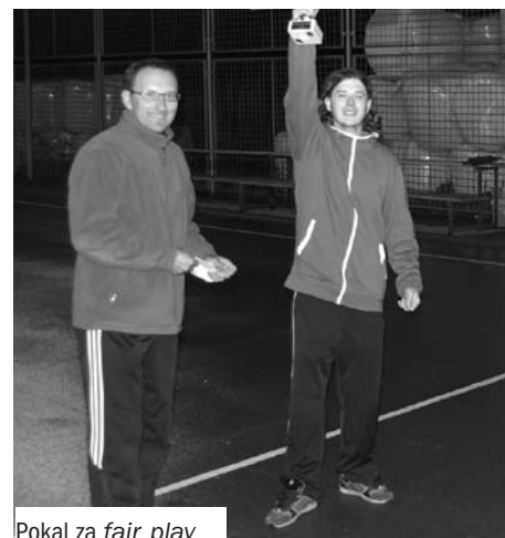
Pokal za fair play