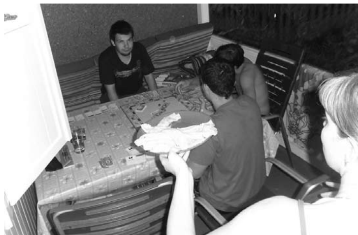
Igranje družabne igre monopoli ob slastnih palačinkah