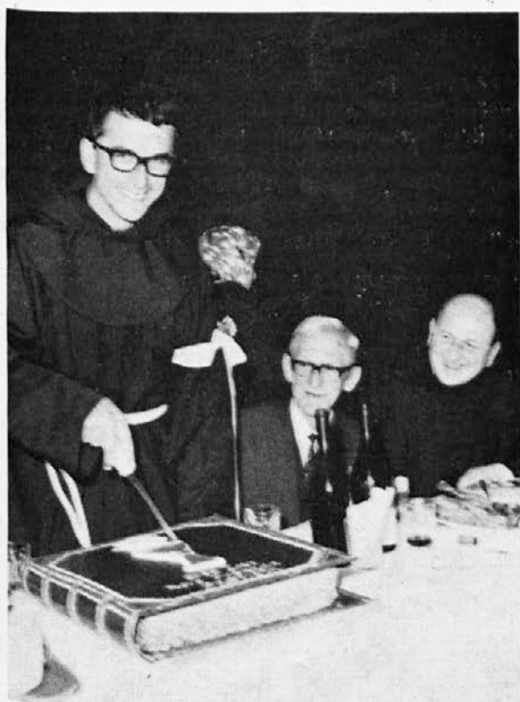
Ob torti v obliki mašne knjige.

★ Kakor sem želel, da bo letos že novi kip krasil naše skupne grobove v nadomestek za ukradenega ter razbitega, bomo morali še potrpeti. Livarna, ki je vlivala prvi kip in ponovno sprejela isto delo, mi je nedavno sporočila, da je lastnik nepričakovano umrl, razen njega pa nihče v livarni ni zmožen vlivati umetniških del. Premalo je bilo časa, da bi do novembra dobil drugo livarno, ki bi sprejela napraviti lepo delo in po zmerni ceni.