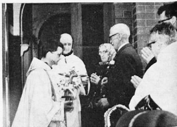
Duhovni starši z novomašnikom