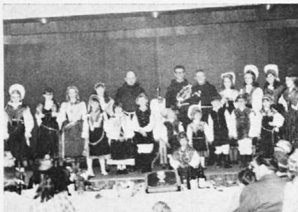
Novomašnik med narodnimi nošami