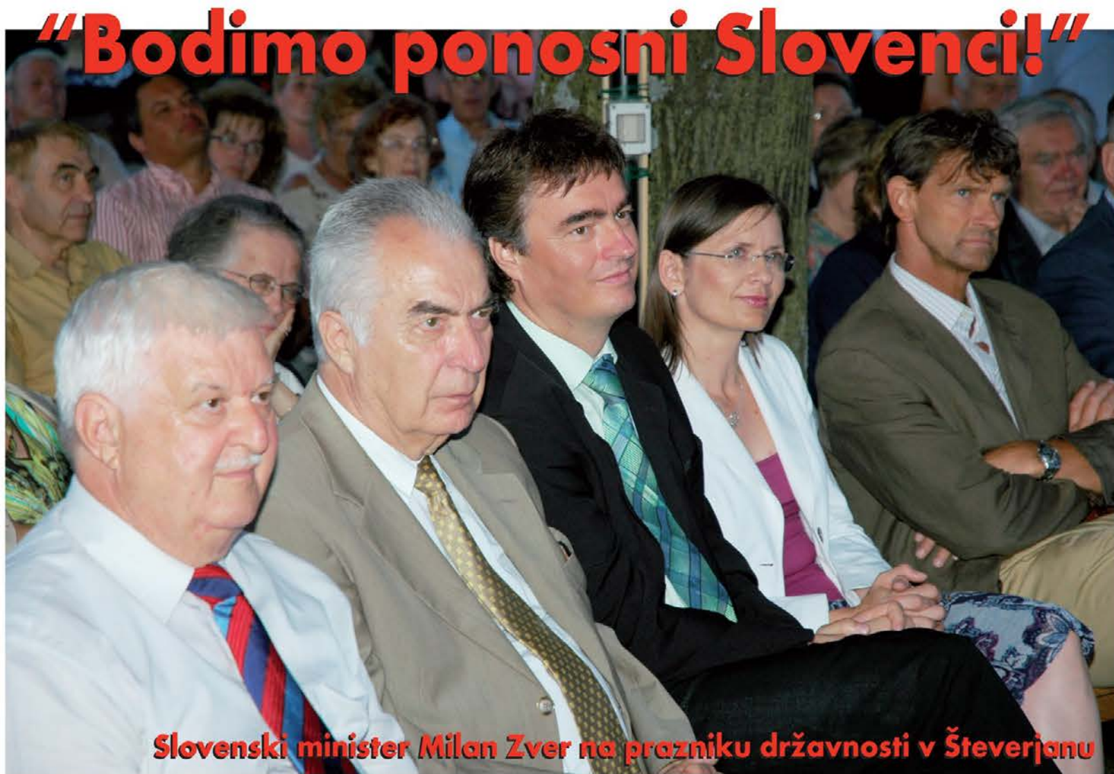
Slovenski minister Milan Zver na prazniku državnosti v Števerjanu

Vse to je RS proslavila ob dnevu državnosti v nedeljo, 24. junija. Osrednja točka slavnostne prireditve je bil stvarni in jasni govor predsednika vlade Janeza Janšę, ki je poudaril glavne pridobitve v tem času tako v notranji kot v zunanji politiki. Pri tem je izpostavil tudi bližnjo vlogo predsedovanja EU. Gotovo je mučno in moteče vplivalo dejstvo, da se proslave prvič ni udeležil predsednik Republike Janez Drnovšek. Te vrstice zaključujemo z voščilom, ki ga je Slovenecem v sobotnem Delu izrekel evropski poslanec Lojze Peterle, prvi predsednik demokratične slovenske vlade: naj zavest o samostojni in demokratični slovenski državi oplemeniti spoštovanje človekovega dostojanstva in svobode.