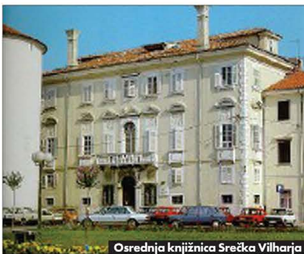
Osrednja knjižnica Srečka Vilharja

Izbrisana identiteta (1993) v italijanščini in hrvaščini, s katero je svojim tržaškim in italijanskim rojakom nazorno, neizpodbitno in prepričljivo razgrnil pošastne razsežnosti fašističnega (in tudi povojnega) raznarodovanja. Kot dober poznavalec srednjeevropskega prostora je pripravil odmevno uvodno predstavitev italijanskega prevoda Brižinskih