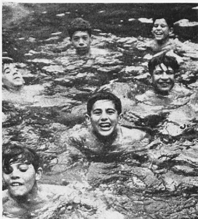
Z gledanjem takih slik se urednik MISLI hladi. Kako pa "vi družji"?

CHOU-EN-LAI po poročilih med Afričani ni imel preveč sreče. Afrika je pač vroča, Afričani pa znajo biti tudi mrzli. Saj jim ni prehudo neprijetno, če se kdo od "velikih" zanje zanima, predaleč pa to zanimanje ne sme iti. Sami želijo postati "veliki" v sredi med Vzhodom in Zahodom. Tudi niso do dna prepričani, da se po kitajski komunistični veličini ne bo zglasila pri njih kakšna sovjetska. Bi bilo nekoliko nerodno. Bolje je pa Chou-En-Lai opravil v Albaniji. V Tirani je spregovoril mogočno besedo: Kdor misli Albanijo pograbiti, naj ve, da ga bo rdeča Kina krenila po predolgih prstih. Ni znano, če sta Hruščev in Tito na to kaj bleknila.