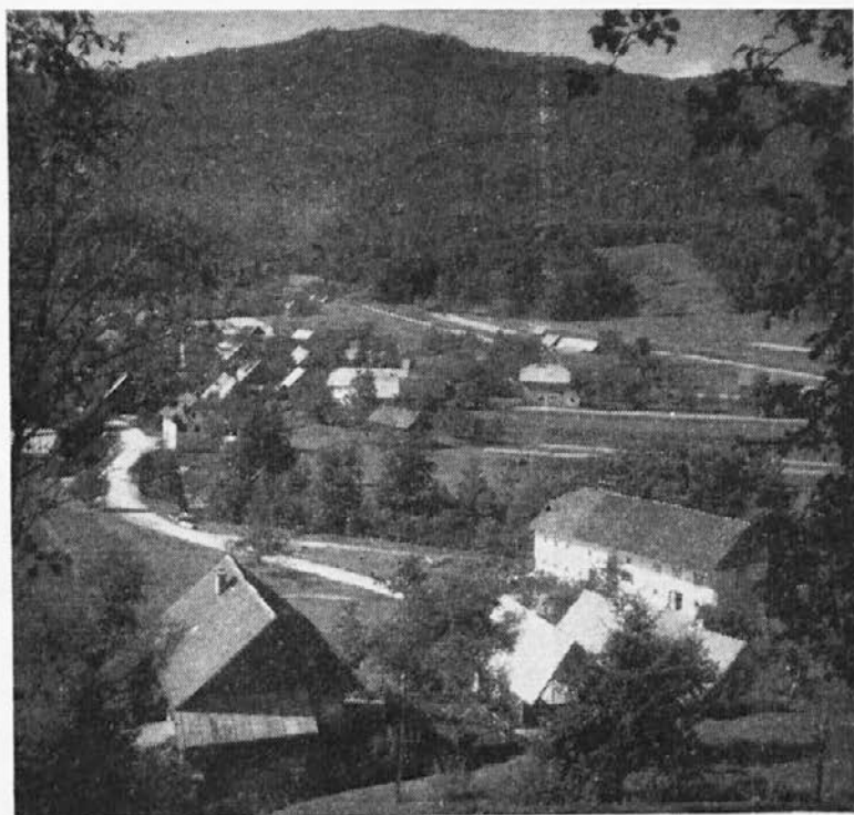
Dolenja vas nad Škofjo Loko