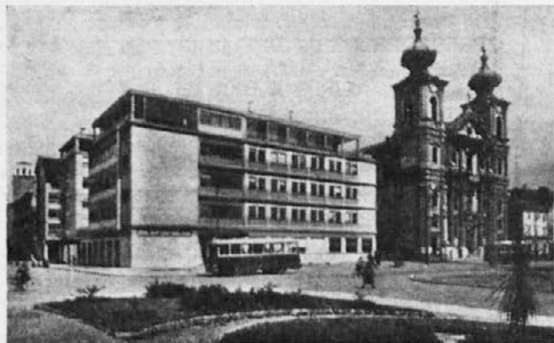
Trg "TRAVNIK", Gorica

Z gornjimi podatki smo obdelali prvo dobo svetogorske zgodovine, ki sega od začetka do dne, ko se je milostna podoba vrnila iz pregnanstva v Ljubljani in sicer najprej v goriško stolnico, naslednje leto pa spet na Sveto Goro. O dogodkih te druge dobe bomo spregovorili prihodnjič.