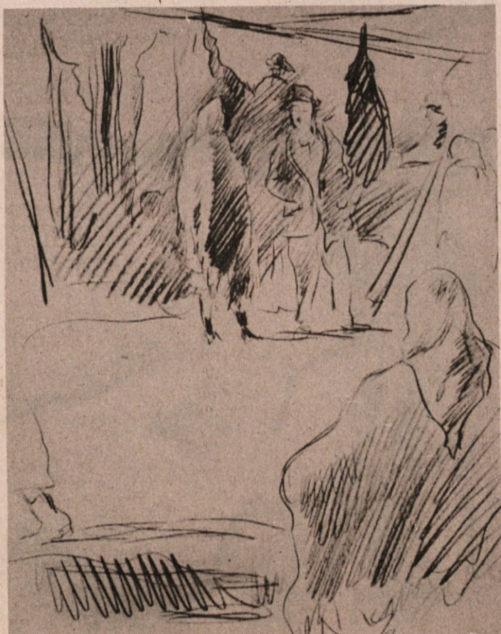
Božidar Jakac: SEMENJ V NOVEM MESTU, črna kreda, 1933