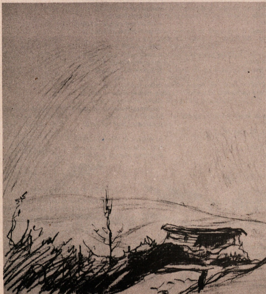
Božidar Jakac: DOLENJSKA PESEM, risba

»Napovedati karkoli, je težko in 'brez ciganke se nič ne ve', kot pravijo. Prepričan pa sem, da knjige v mline vevske papirnice ne bodo zapeljali. Dejal bi celo, da je naklada za tako knjigo nizka. Začudili se boste, če vas spomnim na to, da v vsej slovenski literarni zgodovini do najnovejših dni ni izšlo niti pet tako zajetnih in kompletnih pesniških antologij in da nobene od njih ni mogoče več dobiti na trgu, čeprav so njihove naklade bile znatno večje od teh skromnih dveh tisočev izvodov, kolikor jih premorejo 'Pesmi dolenjske dežele'. S tem hočem reči, da je pravzaprav škoda, da knjiga, ki bi morala biti na voljo vsaj nekaj let, zaradi padanja denarja ne more iziti v večji nakladi, ki bi ji med drugim znižala tudi zdaj kar visoko ceno. A jadikovati je nesmiselna stvar; tako kot pri nas je, pač je. Midva tega ne bova spremenila. Zato bi za konec dejal le še to: jaz sem pri tej knjigi svojo vlogo opravil, zdaj pa so na vrsti ljubitelji poezije, da še oni opravijo svojo in — naklado čimprej pokupijo.«