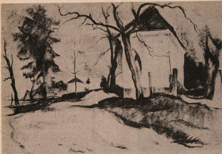
Božidar Jakac: NA GRMU (nekdanja kapelica, v ozadju božji grob), risba, 1936

znanstvena stroka. Mislim pa, da je živa vrednost umetnosti prav v tem, da najdemo v njej tudi sebe, in vrednost vsakega razmišljanja o umetnosti tudi v tem, da se tega zavedamo in da se spoznamo.«