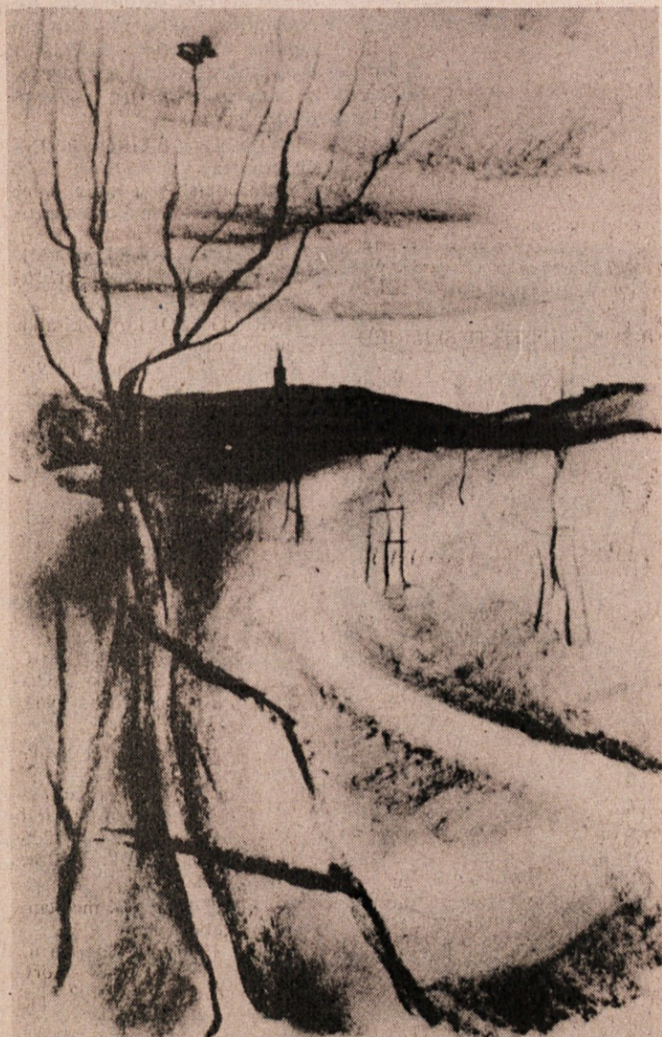
Božidar Jakac: PADA MRAK ..., črna kreda