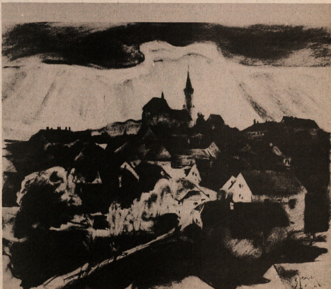
Božidar Jakac: IZ NOVEGA MESTA, risba, 1925