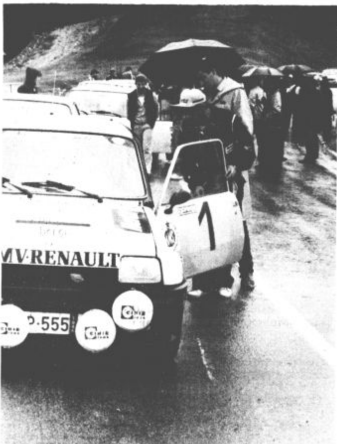
Tekmovanja se je udeležilo 33 voznikov, samo trije pa niso prišli do cilja

Mlajše mladinke: 80 m: 1. Horvat (MB), 4.—5. Silovšek (Velenje); disk: 1. Erjavec (KL); 100 m: 1. Pavlovič (GO), 2. Krenker, 5. Burger, 9.—10.—11. Podgoršek (vse Velenje); daljina: 1. Horvat (MB), 5. Prisljan, 7. Podgoršek, 8. Glamuzina (vse Velenje); 200 m: 1. Krenker, 4. Burger, 5.—6. Prisljan (vse Velenje); 800 m: 1. Mihovljanec (KL), 6. Jošt (Velenje); krogla: 1. Erjavec (KL), 9. Jošt, 11. Vovk (oba Velenje); višina: 1. Podgoršek (KL); 4 x 100 m: 1. AD Maribor I, 2. AK Velenje I, 3. ZAK Ljubljana; ekipna uvrstitev: 1. AD Maribor 130,5 točke, 2. AK Klavdivar 128,5, 3. AK Velenje 107,5 točke.