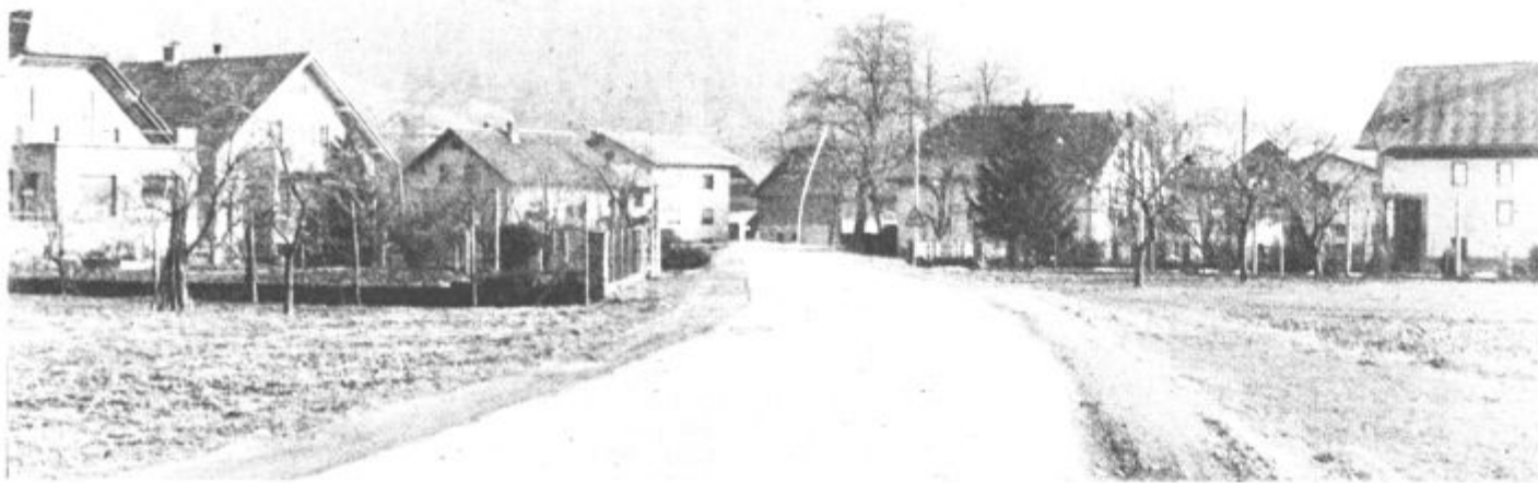
Ob občinskem prazniku bodo predali svojemu namenu primarni del vodovodnega omrežja v Gavcah