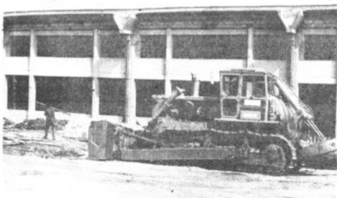
Organizacije združenega dela v občinah Velenje in Mozirje imajo veliko vozil in strojev, ki niso v celoti izkoriščeni.

Komisija za promet in zveze si je tudi prizadevala, da poenoti mestni in primestni promet. Na našem območju sta dva avtobusna prevoznika — APS REK in Izletnik. Uspelo jim je, da sta obe delovni organizaciji predložili programe linij mestnega in primestnega prometa. Trenutno pa pripravljajo razporede, katere vožnje bo kdo opravljal. Stremijo za tem, da bi kar največ prevozov opravljali z rednimi linijami in ukinjali pogodbene prevoze, ki so v številnih primerih dražji. Ta analiza bo izdelana v kratkem, po novem pa bodo prevoze uveljavili z novim letom.