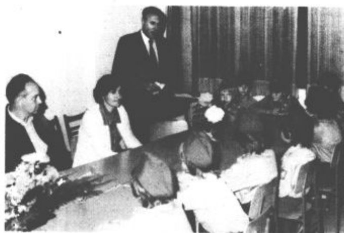
Za mlade tekmovalke so pripravili sprejem tudi na občinski gasilski zvezi. Udeležili so se ga tudi predstavniki družbenopolitičnega življenja občine Velenje.