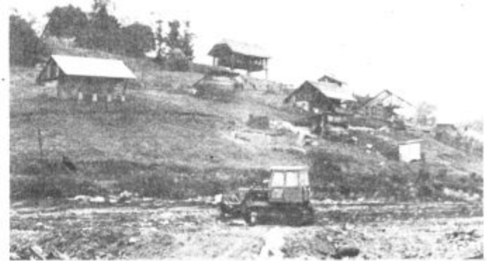
Tu bo okoli 30 kunčjih farm.