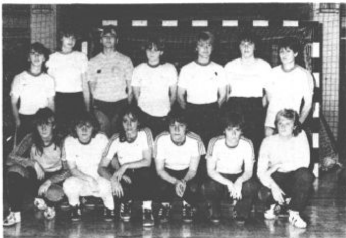
Pomlajena ekipa rokometnic Velenja se bo v jesenskem delu prvenstva potegovala za uvrstitev od 6. do 9. mesta

Velenjčanke so se začele pripravljati na jesenski del tekmovalnega v drugi zvezni rokometni ligi — sever v začetku meseca avgusta. Na kondicijskih pripravah so bile na Kopah na Pohorju, do sedaj pa so odigrale že 16 prijateljskih srečanj. Trenirajo petkrat ali šestkrat na teden v Rdeči dvorani. »Marljivost in pripravljenost vseh tekmovalnic in trenerja, skupaj z upravo kluba, nas kljub velikim spremembam navdaja z optimizmom. Res pa je, da je konkurenca v tej tekmovalni sezoni v II. zvezni ligi-sever zelo močna, saj v njej nastopa kar sedem bivših prvotigaških ekip.