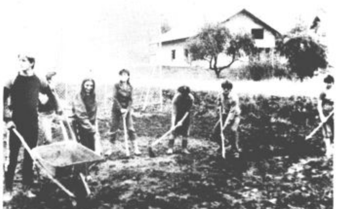
Letošnji krajevni praznik bo v krajevni skupnosti Lokovica nadvse slovesen

Krajanje krajevne skupnosti Lokovica so torej lahko na svoje pridobitve zelo ponosni. Ob tej priložnosti se bo na razširjeno telefonsko omrežje priključilo še 40 novih naročnikov. Ob praznovanju krajevnega praznika so pripravili Lokovičani tudi pester kulturni program, v katerem bodo sodelovali moški in ženski pevski zbor iz Lokovice, mladinci ter godbeniki Zarje iz Šoštanja.