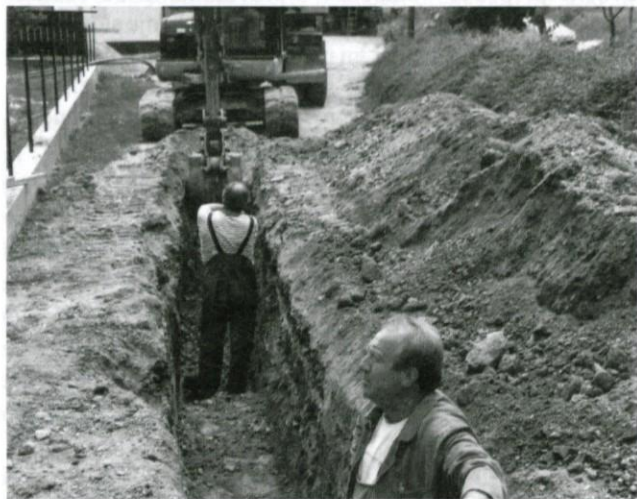
Gradnja kanalizacije v Lipcah.

Delavci Gradbeništva in instalacij iz Ljubljane kot podizvajalci Cestnega podjetja Ljubljana so v poletnih mesecih v tistem delu Logatca, ki mu pravimo Gorenja vas, natančneje med Režišami in Strmico zgradili kanalizacijo, vodovod in položili instalacijo za kabelsko televizijo. Tako je tudi ta del Logatca na veliko zadovoljstvo vaščanov komunalno urejen.