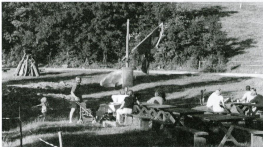
Najmlajši - so prvi pohiteli k evropskemu kresu.

Leto je naokoli. V preteklem letu je bilo veliko narejenega. Želimo si še več tako uspešnih let in sodelovanja vaščanov, občinskih in krajevnih institucij in vseh ostalih organizacij.