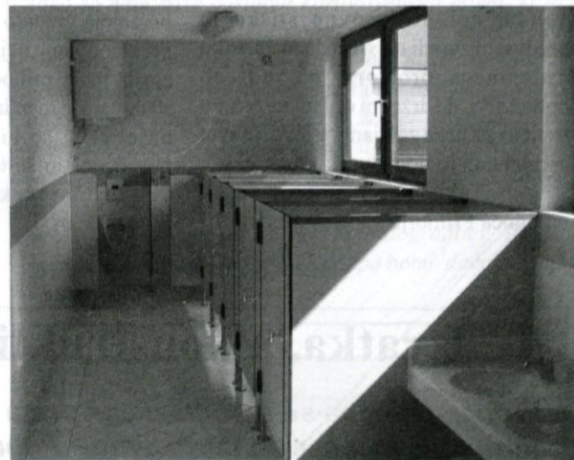
Obnovljene sanitarije v vrtcu.

Občina je letos poleti podpisala pogodbo za asfaltna dela na Logaškem v letih 2004/06 s Primorjem iz Ajdovščine kot nosilcem poslov; podizvajalec pa bo Cesto podjetje Ljubljana. V navedenih letih bo opravljenih del za 160 milijonov tolarjev. V letu 2004 naj bi se tako poasfaltirale ceste in ulice: Čevica (210 m) – po pravkar izvedeni prenovi vodovoda, izgradnji kanalizacije in po vkopu cevi za razvod javne razsvetljave –, Vodovodna (210m), Rožna-Pod gozdom (450 m), Plesiše (250 m), Jačka (100 m), Dol (120 m) – po izgradnji kanalizacije in javne razsvetljave (zemeljska dela so bila opravljena že lani) –, dostopna cesta PS Kalce (175 m), Kalce-Vrabc (220 m), Režiška (300 m), Pokopališka (120 m), Strmica (500 m), Lipica (150 m), Grajska (280 m), Zavratec-Vrh Sv. Treh Kraljev (1100 m), Laze-železniška postaja (300 m).