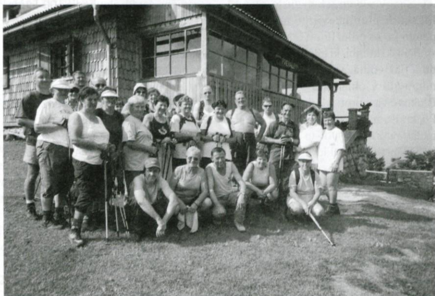
Pred kočico na Prevali.

... sablje, sulice, bajonete, čelade, epolete, uniforme, odlikovanja, oficirske kape in druge zanimive stare vojaške predmete ter vojaške fotografije izpred leta 1953 – kupi Vojni muzej Logatec, Tržaška 81a, 1370 Logatec (tel. 7542-781)