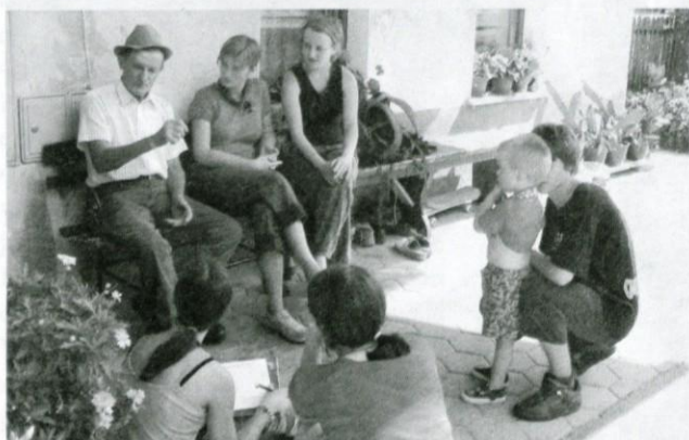
Tako je Vavknov Domine vzpodbujal radovednost mladih raziskovalcev.

Hotedršica je med 31. julijem in 7. avgustom gostila etnološko raziskovalni tabor Etnostep Hotedršica 2004, ki ga je za mlade pripravil Mladinski svet Ajdovščina; ta vključuje 7 mladinskih društev. Pri soorganizaciji je največ pripomoglo ajdovsko Društvo tabornikov Rod Mladi bori. Poleg omenjenih društev so k izvedbi veliko prispevali tudi Občina Logatec, iz Hotedršice pa krajevna skupnost, Športno ter Kulturno turistično društvo. Letošnjega tabora se je udeležilo 25 taborečih iz Ajdovščine, Nove Gorice, Hotedršice ter iz okolice Celja.