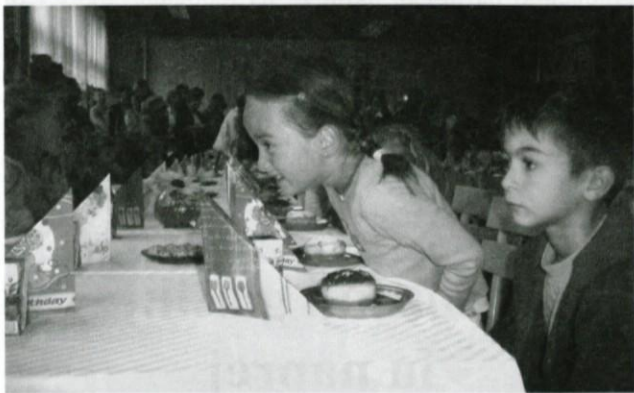
To bo lepo v prvem, a ne?

S prvim septembrom so se spet odprle šolske dveri in skozi njih so vstopili šolarji, od tistih, ki bodo začeli brazde učenosti, do tistih, ki jih bodo sklenili. Vseh šolarjev se je v drugem letu, odkar je uvedena devetletka, naštelo 1328.