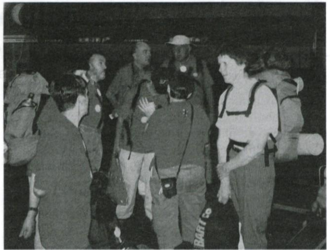
Romarji so se zbrali na ljubljanski železniški postaji.