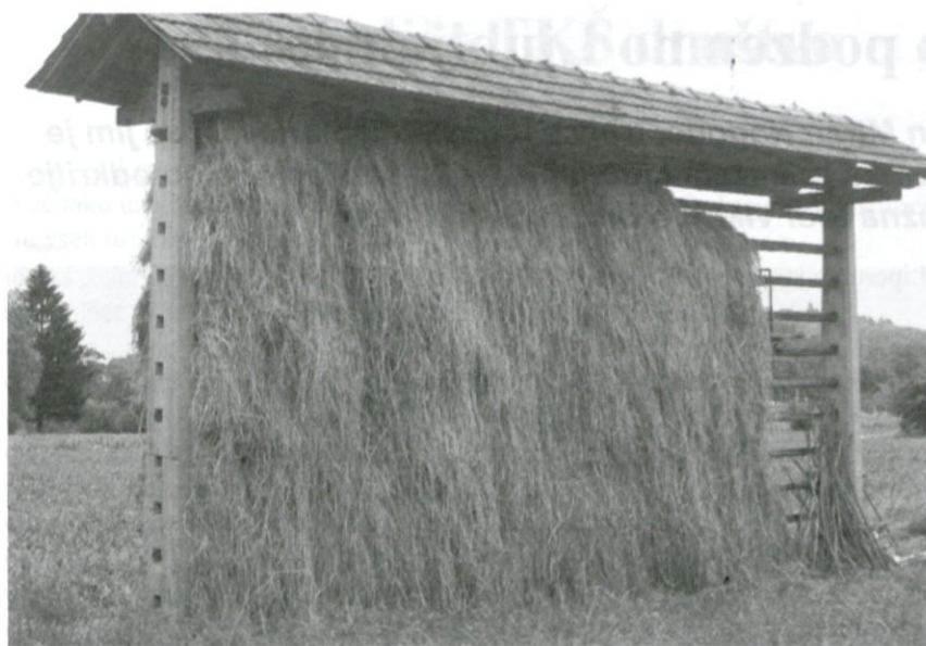
Kozolec danes in ...

vztrajajo pri reji živine in obdelavi, ob takih pogojih videli prihodnost in možnost razvoja kmetije. Zato je