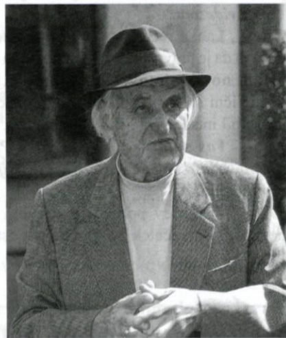
Graditelj še v poznih osemdesetih.