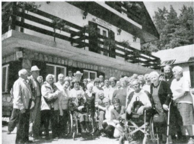
Pred Tončkovim domom na Lisci.

V dopoldanskih urah zadnjega junija je avtobus odpeljal 52 težjih invalidov na prečudovit izlet na Lisco (948 m). V lepem in ne prevročem sončnem dnevu so invalidi, ki niso mogli na vrh Lisce, lahko uživali v razgledovanju s terase Tončkovega doma proti dolini Save in veselo kramljali. Tisti pa, ki so znogli premagati še nekaj višine, pa so še posebej uživali v razgledu panorame Slovenije, ki ga ponuja vrh Lisce.