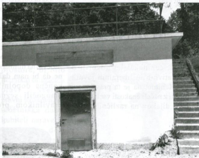
Davni spomini ... Foto in besedilo: France Brus

Leta 1898, v 50. letu vladanja Nj. Veličanstva presvetlega cesarja Franca Jožefa I. so leta 1898 z izdatno pomočjo habsburške države in dežele Kranjske zgradili na Naklu v Logatcu prvi vodni zbiralnik, ki je zadoščal vodovodnim potrebam Dolenjega Logatca vse do konca druge svetovne vojne. Do takrat so zdržale tudi litoželezne cevi, ki so jih po vojni zaradi dotrajanosti začeli zamenjevati