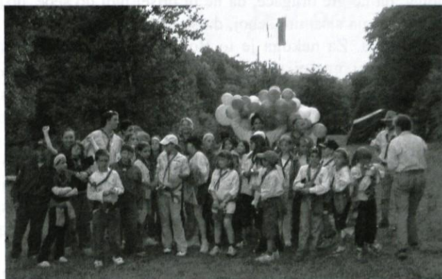
Med najmlajšimi slovenskimi in francoskimi volčiči.

Po sprejemu v Logatcu se je obisk francoskih skavtov nadaljeval v vasi Božakovo ob Kolpi, kjer so teden dni preživeli v druženju z logaškimi skavti. Njihov program se je prepletal ob spoznavanju skavtskih veščin, duhovnosti, življenja v naravi, v spoznavanju različnih običajev in navad, kulinarike ter ob medsebojnem sporazumevanju v angleškem, francoskem in slovenskem jeziku. Po tednu