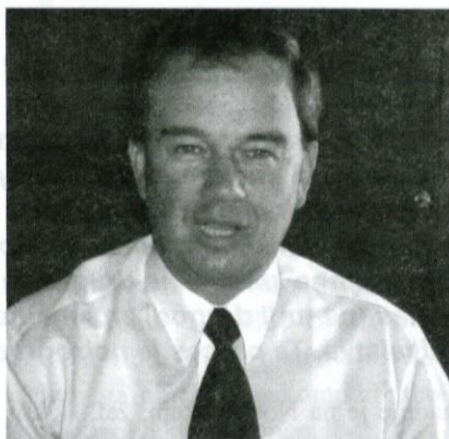
Župan predstavlja prostorski plan.

Ureditev velja za tri leta. V tem času bo treba v Sloveniji pripraviti nove prostorske načrte. Država se je odločila za bolj urejeno načrtovanje in organizirano rabo prostora. Uvedla je nov pojmovnik prostorskega urejanja,