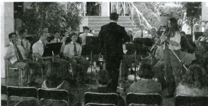
Promenadni koncert logaških godbenikov v avli največjega češkega zdravilišča Klinkovice pri Ostravi.

Zamikali so nas novi izzivi. Do najvišje možne ravni bi ponovno radi dvignili kvaliteto orkestra, zato smo se prijaviili na Mednarodno tekmovanje pihalnih orkestrów 23. in