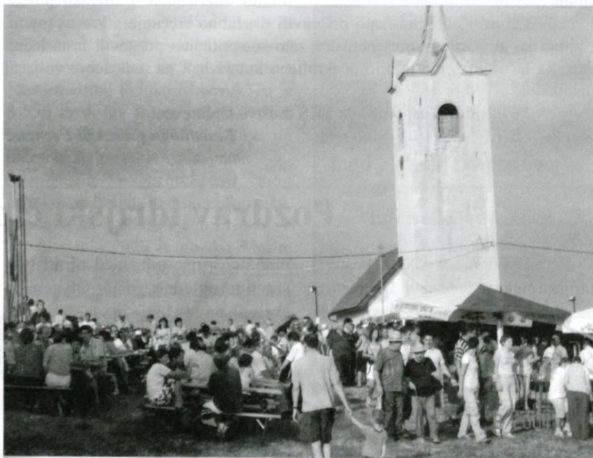
Vse živo, ko se nebo še ni razjezilo.

Sicer pa je bil dogodek ob Domu Medved namenjen predvsem zabavi in sprostitvi. Prek 3000