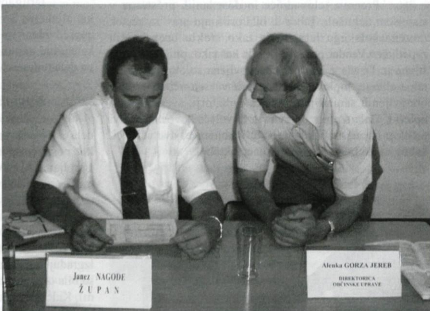
Tik pred odločitvijo o pasu za zavijanje v levo.

Tako spremenjeni odlok omogoča Primorju začetek gradnje 17