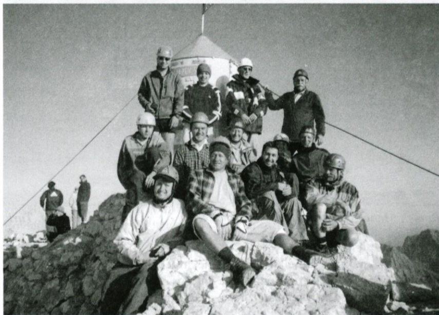
Navdušeno nasmejani planinci pred Aljaževim stolpom.