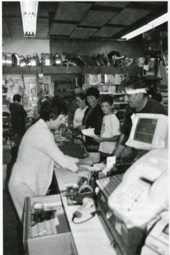
Šele po prvem septembru se je gneča nekoliko polegla.

Nekaj dni pred pričetkom novega šolskega leta je v Kettejevi knjigarni in papirnici v Logatcu prevladovala nepopisna gneča. Čeprav si osnovnošolci največ šolskih knjig izposodijo kar v šoli iz knjižnega sklada, in ob koncu leta poplačajo obrabnino, si morajo nakupiti celo vrsto običajnih in delovnih zvezkov in drugih šolskih potrebščin.