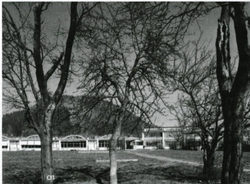
Osnovna šola v Stražišču, varovana kot kulturni spomenik.