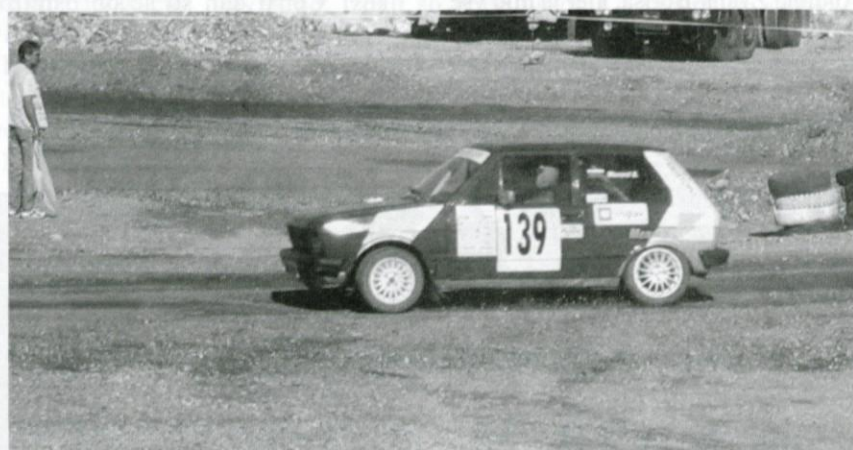
Domen Menard uspešen tudi v diviziji 1,4.