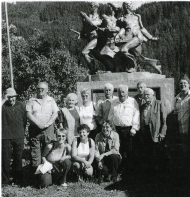
Z logaškimi borci na Koroškem.

Na poti domov je za vedro razpoloženje v avtobusu poskrbel ženski zborček z lahkotnim popevanjem, tako da se je tudi pot domov po celodnevem potepanju prijetno končala.