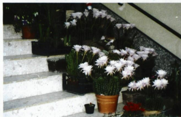
Cvetoče in one druge kakteje.

Karolina Reven , se najraje ubada s kaktejami-kaktusi; z vso blagostjo, spoštljivostjo in zaupanjem vzgaja težko določljivo število vrst teh eksotičnih lepot. Karolino navdahnejo tudi s kako pesniško prisposodbo; tudi takole: