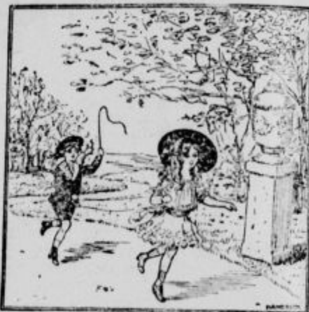
Kje je naša učiteljica?