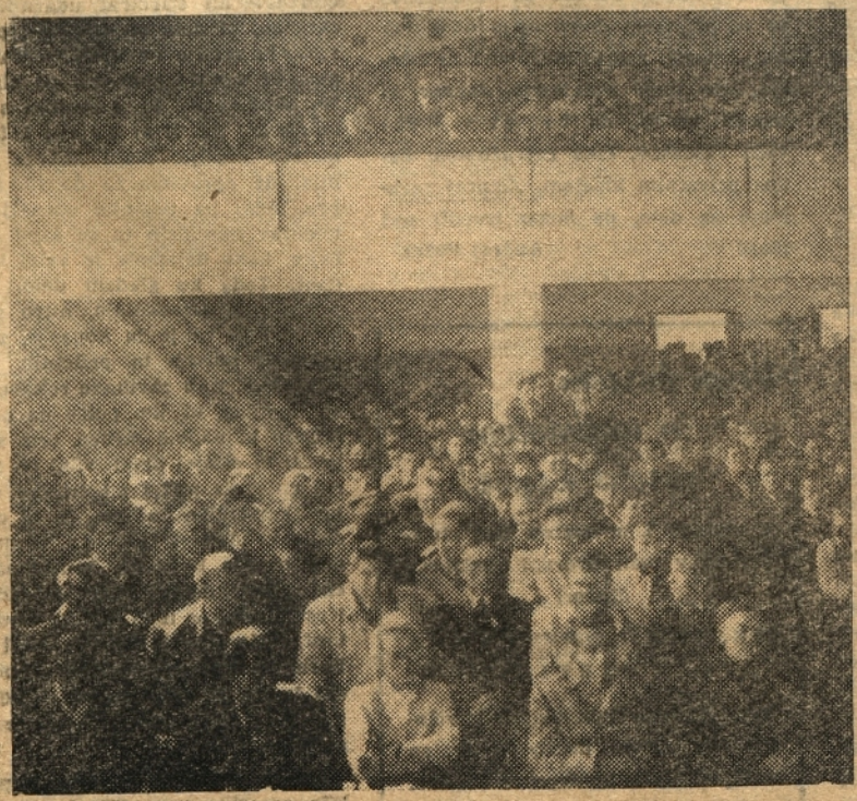
Velika dvorana novega združnega doma je bila ob zaključku IV. festivala polna.

Takšen način odmere davka je brez dvoma zelo demokratičen in so ga deležni kmečko—davkoplačevalci razen pri nas samo še v FLRJ. Treba je samo, da se naši delovni ljudje zavedajo široke demokratičnosti naše oblasti in naših predpisov ter da začno dejansko uživati pravice, ki jim pripadajo. Se v teku lanske davčne kampanje smo nalezeli na ljudi, ki bolj iz nevednosti kakor iz omalovaževanja niso prišli na sestanek, kjer se je (Nadaljevanje na 2. strani)