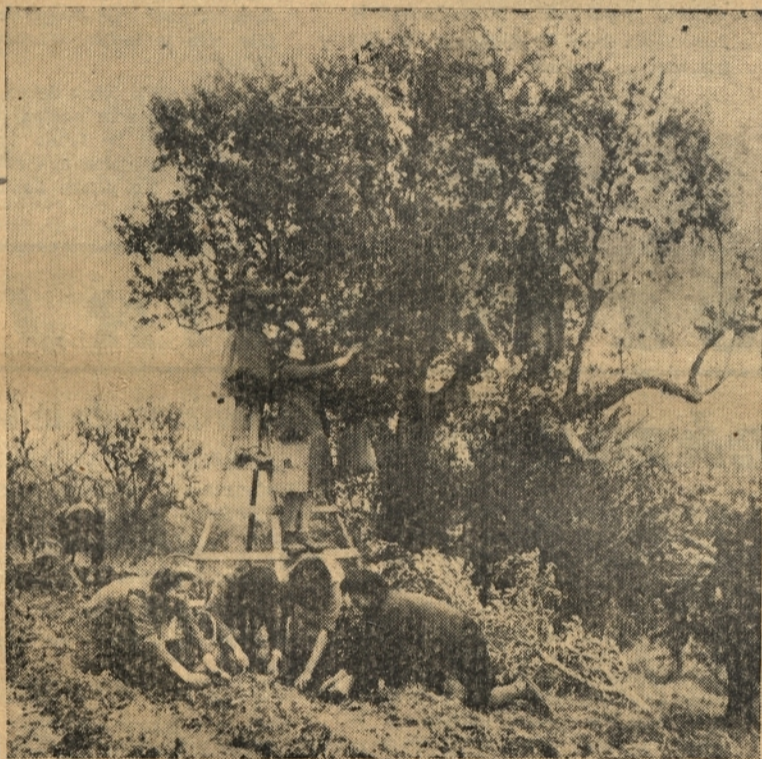
Oljke so dozorele — pobirajmo jih!

Ko smo uredili čebele, satje in gnezdo, pustimo panje lepo na miru, dokler ne pritisne mraz. Takrat opravimo zadnje čebelarstvo delo. Prinesemo v panj starih odej, vreč in slamatih blazin. Slame z omlačnim klastjem in tudi sena ne potrebujemo, ker je v njih marsikatero zrno, ki vabi pozimi v čebelnjak rovkve in miši.