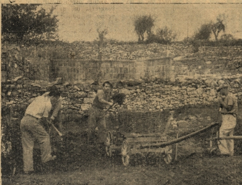
Pomjančani si gradijo vodnjak

Vsekakor je tu potrebno, da okrajni odbor SIAU daje več pomoči gornjim vasem, njihovim frontnim odborom, da prouči njih stališče iz kakršnega koli vidika, skratka da jim nudi najširšo pomoč, če hočemo, da tudi Marezgani, Sičovljani in Koštabonci sodelujejo z nami, v naši borbi za izpolnitev enoletnega plana.