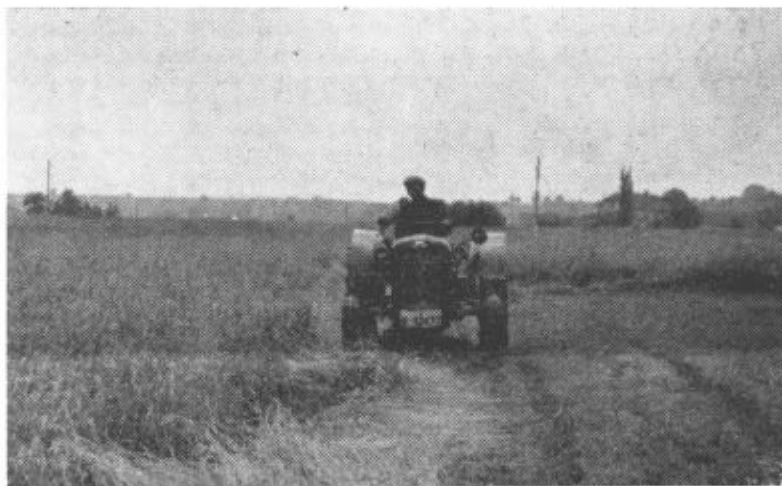
Žetev s kombajnom ima prednost pred žetvijo s traktorjem