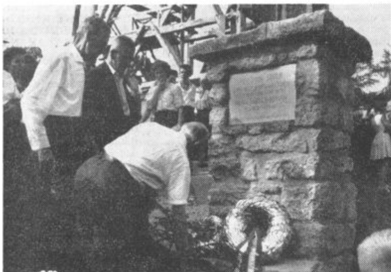
Turistično društvo v Zavrhu je 21. julija letos odkrilo generalu Maistru spominsko ploščo. Maister se je v Zavrhu večkrat zadrževal na oddihu. Na sliki: Maistrovi borci med polaganjem vencev pred ploščo