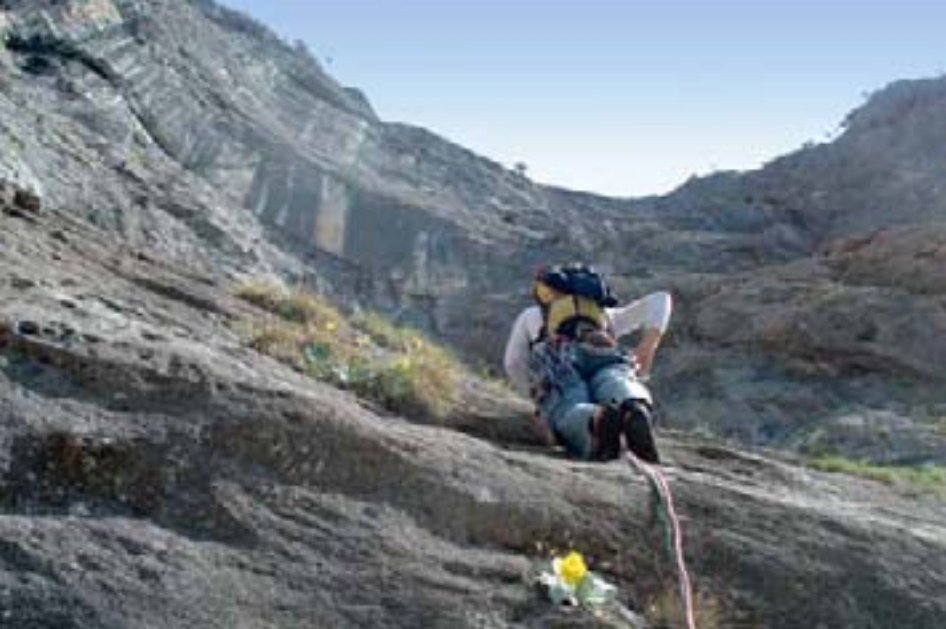
Mogočni amfiteater Strevčeve peči

so. Kjer obstajajo možnosti naravnega varovanja, zaman iščemo kos kovine, zavrtane v skalo, ki bi nam malce olajšal ali prihranil navijanje v glavi.