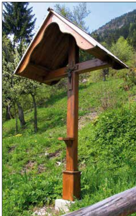
Križ pod Nežno hišo blizu stare cerkve.

nije, potem pa smo šli v procesiji z lučkami čez Hrib h križu in ga blagoslovili. Dneve dražgoške tragedije je preživel, potem pa je zaradi slabše kvalitete lesa in nevdzdrževanja kmalu strohnel.