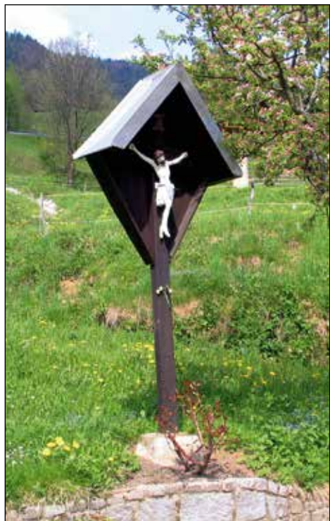
Križ ob hiši Dražgoše 24, Spodnji Gabrc.