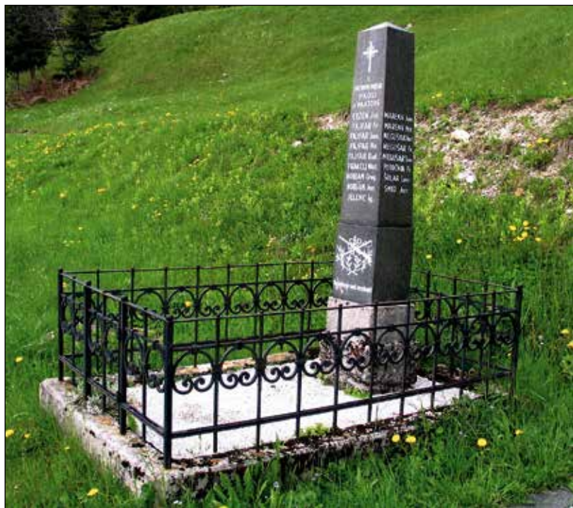
Spomenik padlim domačinom v prvi svetovni vojni, na starem pokopališču ob porušeni župnijski cerkvi sv. Lucije.

ko je bilo leta 1961 zgrajeno novo pokopališče pod vasjo, prestavljen na mesto, kjer stoji zdaj – pod Šimnovo hišo.