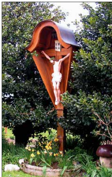
Lepo obnovljen križ ob Novakovi domačiji, Dražgoše št. 1.

Zakaj je bilo v Dražgošah toliko kapelice in znamenj? Najverjetneje zato, ker so bile Dražgoše zelo znana romarska pot. Skoraj zagotovo pa jih je nekaj nastalo tudi zaradi procesij. V starih Dražgošah je velikonočna procesija vodila od stare cerkve do kapelice svetega Jožefa na Hribu in nazaj. Procesija svetega Rešnjega Telesa pa se je vila še dlje, v vas Na pečeh. Prvi evangelij je bil pri kapelici pri mežnariji, drugi pri kapelici svetega Jožefa na Hribu, tretji pa