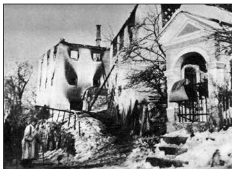
Štihlnova kapelica Na žerel (Dražgoše Na pečeh). Slikano po požigu vasi, pred miniranjem leta 1942. V ozadju požgane Tomažkove hiše. Zdaj na tem mestu stoji Koritnikova hiša.