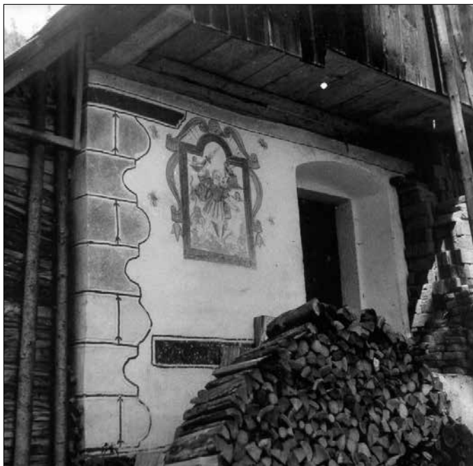
Šimnova kašča v vasi Pri cerkvi s šivanimi robovi in fresko sv. Mihaela iz druge polovice 18. stoletja.

mi to sporočijo. Vesel bom vsake najmanjše podrobnosti, saj želim, da se znamenja, ki pričajo, da so pod Dražgoško goro živeli verni ljudje, vsaj v takšni obliki ohranijo mlajšim rodovom.