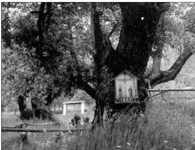
Leseno znamenje s podobo Kristusa na križu na stari Hkavščovi hruški, ki je stala ob poti blizu vhoda na novo pokopališče.