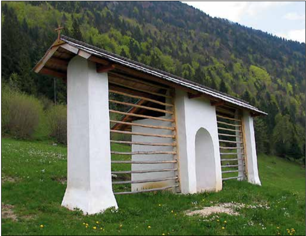
Tinetov kozolec iz leta 1893 s kapelico v sredini v osrednjem delu vasi Na pečeh.

Kapelica v Tinetovem kozolcu na Hribu je kot orientacijsko znamenje vrisana že v avstrijskem vojaškem zemljevidu, izdelanem v letih 1763 do 1782, prav lahko pa je še kakšno stoletje starejša. Sezidana je bila ob poti, ki je tedaj vodila iz vasi Na pečeh k cerkvi. Domneva se, da so, ko so nekoliko niže speljali novo pot z manj vzpetine, ob tej poti zgradili tudi novo kapelico svetega Jožefa, to zgornjo kapelico pa opustili. Opuščene se še jaz spominjam pred 70 leti.