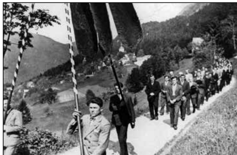
Procesija svetega Rešnjega Telesa.

Zakaj je bilo v Dražgošah toliko kapelice in znamenj? Najverjetneje zato, ker so bile Dražgoše zelo znana romarska pot. Skoraj zagotovo pa jih je nekaj nastalo tudi zaradi procesij. V starih Dražgošah je velikonočna procesija vodila od stare cerkve do kapelice svetega Jožefa na Hribu in nazaj. Procesija svetega Rešnjega Telesa pa se je vila še dlje, v vas Na pečeh. Prvi evangelij je bil pri kapelici pri mežnariji, drugi pri kapelici svetega Jožefa na Hribu, tretji pa