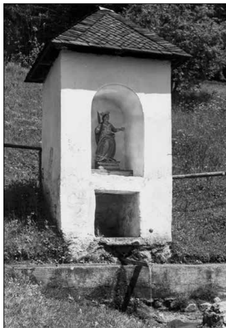
Kapelica svete Lucije nad pokopališčem pri stari cerkvi.