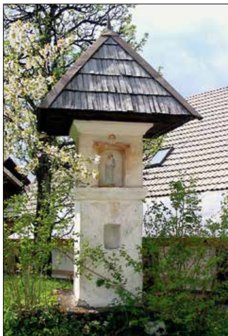
Orientacijsko znamenje iz leta 1699, ob robu vasi Na pečeh.