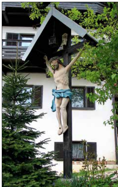
Znamenje – vaški križ pred Šimnovo hišo (v srednjem delu vasi Pri cerkvi).

Pod Vratnim robom je pastir ovčar Strojcov Polde iz Železnikov nad nevarnim prehodom čez drčo v priprošnjo za srečno pot nekaj let pred drugo sve-