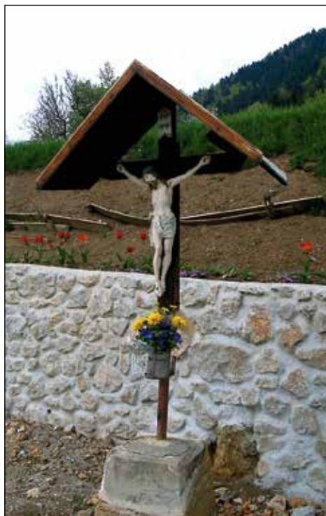
Križ na križišču pred Rovtarjevo hišo Na pečeh.