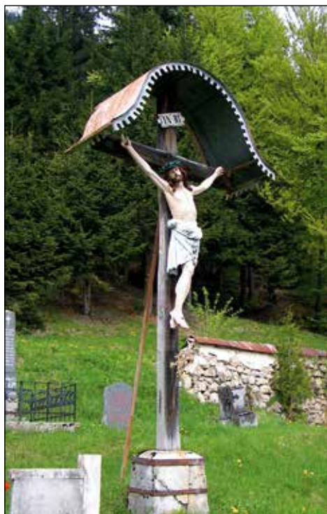
Križ na pokopališču ob stari porušeni župnijski cerkvi sv. Lucije.

Spominjam se ene takih tabel v Smrečju na Hkavščovem kozolcu, kjer je pisalo, da je tam nekdo umrl od lakote. Za Jelensko goro je bila na kopišču na neki smreki tabla, kjer je pisalo, da je tam umrl Šturmov oče, ko je kuhl kopo.