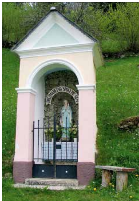
Lojzetova kapelica lurske Matere Božje – leto nastanka 1908 (v vasi Pri cerkvi).