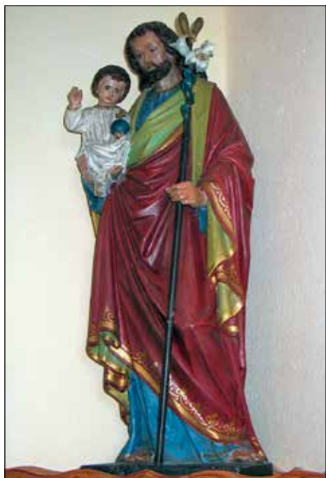
Kip sv. Jožefa z Jezusom iz kapelice Na hribu, ohranjen v župnijski cerkvi Sv. Lucije.