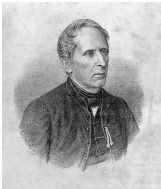
Dr. Janez Bleiweis, Novice, 1893.

kandidata društva »Slovenija«. 90 Pri nasprotovanju Zarnikovi kandidaturi naj bi izstopal Bleiweis. V Zarniku naj bi zaslutil moža, »ki bo kalil tišino in povzročil nesoglasje v vrstah slovenskih poslancev kranjskega deželnega zbora«. »Slovenija« je zato sklenila povprašati zaupne može volilnih okrajev, koga nameravajo voliti. Bleiweis naj bi jim Zarnika očrnil kot nevarnega prihodnja Dežmana ali Kluna 91 (najbolj znana narodna odpadnika). Pisma so svarila trebanjske volivce pred Zarnikom, ki da je egoist in nasprotnik duhovščine. 92 Pismo, ki ga je društvo »Slovenija« poslalo dolenskim poverjenikom, je omenjalo, da so Bleiweis in dunajski slovenski poslanci zoper Zarnikovo izvolitev, njegovi kandidaturi naj bi odločno nasprotovala Toman in Svetec. 93