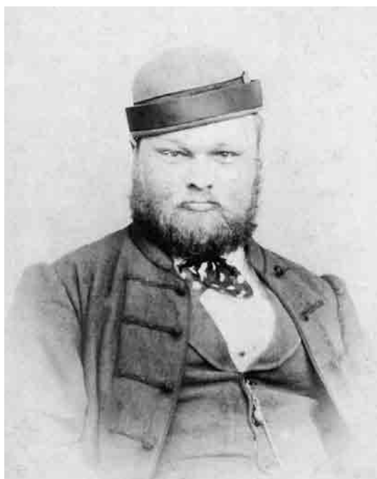
Dr. Valentin Zarnik