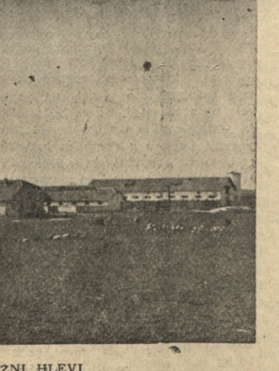
NOVI ZADRZNI HLEVI

Važno je pri tem ugotoviti, da so hotele Benetke imeti Milje brezopojno v svojih rokah, ker so imele namen osvoboditi Trst, s katerim so bile v vojni že nad 10 let.