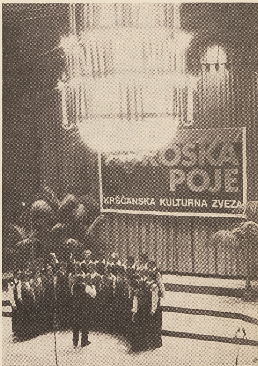
„Koroška poje“ v celovski koncertni dvorani

Ni dvoma, da je bilo lansko leto tudi leto kulture; poleg jubilejnih 10. Koroških kulturnih dni v Celovcu so se skozi celo leto vrstili večji in manjši kulturni dogodki. Na Radišah so odprli nov kulturni dom, Krščanska kulturna zveza in v njej vključena društva so organizirala dobrih 300 kulturnih prireditev. Pri nas so gostovale sve-