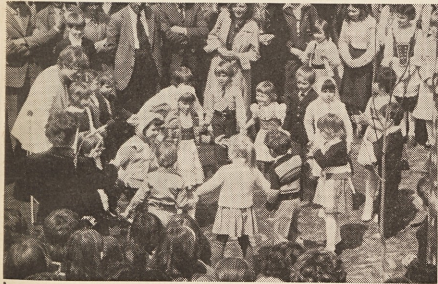
Novi otroški vrtec za Sentprimož

Boj za izpolnitev člena 7 gre dalje, je zapisal predsednik NSKS dr. Matvez Grlic v uvodnem članku 1. številke NT leta 1979 in pozval vse k vztrajnemu prizadevanju na gospodarskem, političnem, kulturnem in družbenem področju.