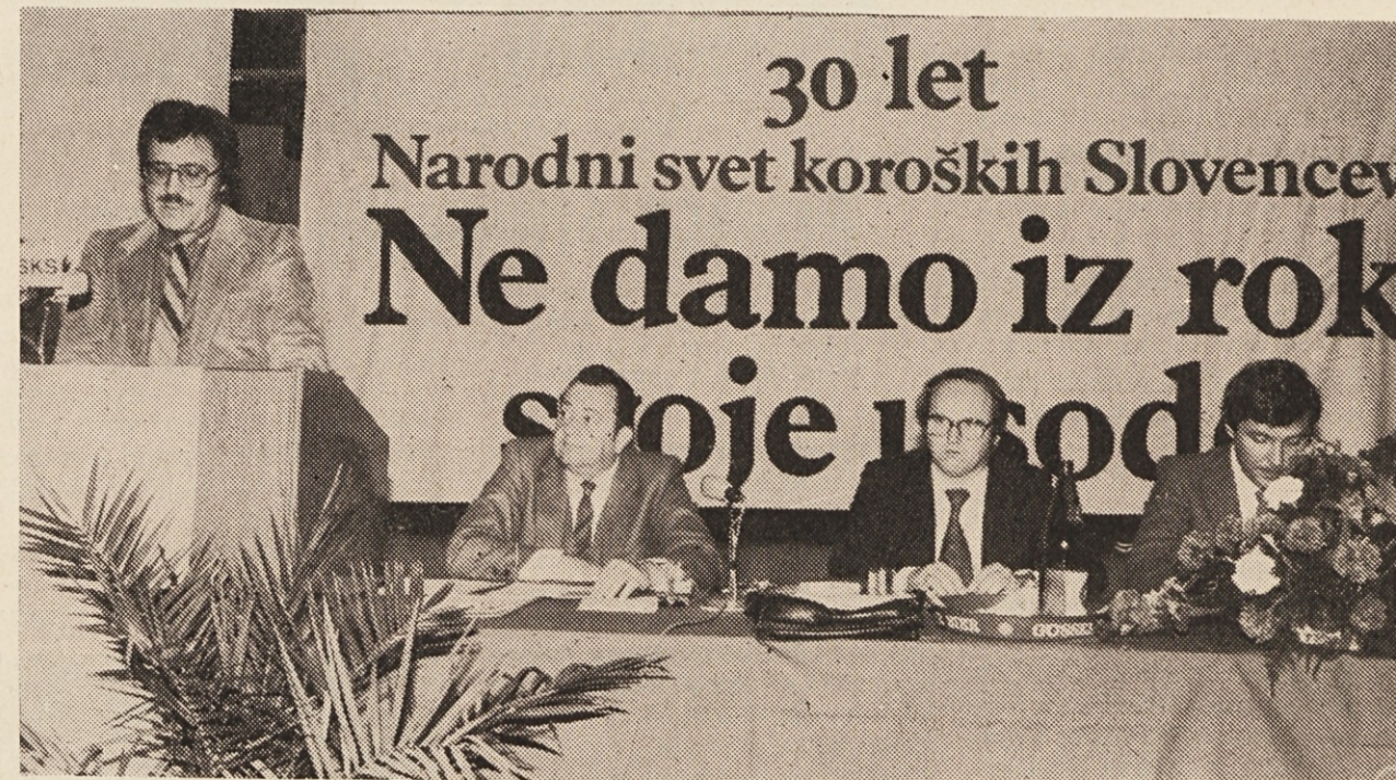
Občni zbor Narodnega sveta koroških Slovencev na Radišah

Meseca julija so v (preimenovali) tovarni celuloze „Obir“ na Rebrci spet