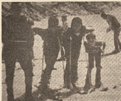
Trening na ledeniku

„Dosedaj najbolj zajamemo mladino tja do petnajstega leta. Pozneje grejo v poklicno življenje in jih zelo težko dobimo skupaj. Pa tudi možnosti za trening nimamo najboljših. Nimamo lifta in tako rekoč treniramo samotež. Kljub temu smo pri zadnjem rožanskem prvenstvu zasedli kar 7 prvih mest. Trenirati začnemo okoli oktobra,