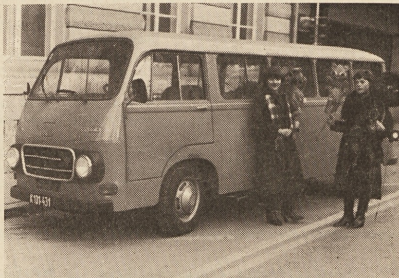
Z minibusom novomeškega IMV — podarila ga je Skupnost otroškega varstva — gre KDZ v novo leto.