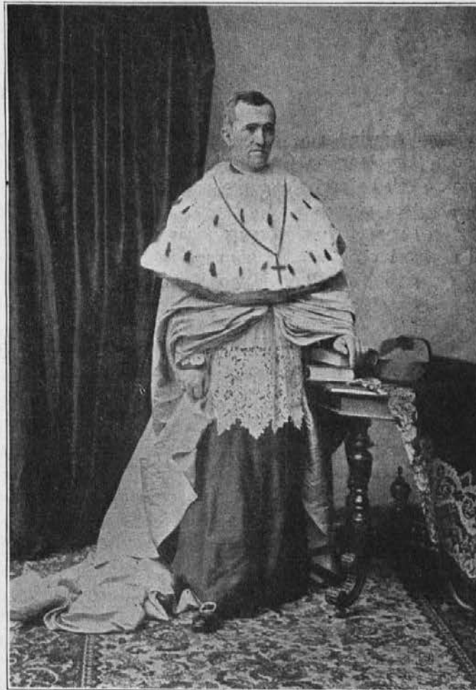
Dr. Anton Bon. Jeglič. knezoškof ljubljanski.

Kdor ve, kaj pomeni Dr. Jeglič za našo drago domovino, ta je na dan njegovega srebrnega škofijskega jubileja, in bo na dan njegovega