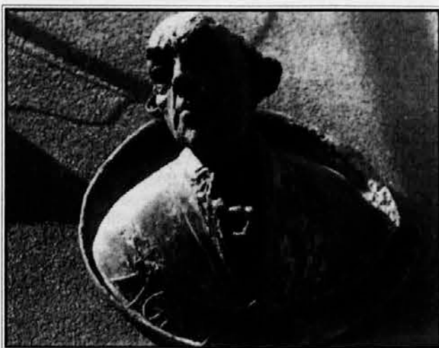
Zoisov doprnski kip v bronu, postavljen l. 1992 na zgradbi Breg 22 v Ljubljani. Avtor je akademski kipar Mirsad Begić iz Ljubljane.

Trditve o Žigi Zoisu - gojencu kakega plemiškega zavoda so neosnovane in "modenske viteške akademije v Reggio" ni bilo,