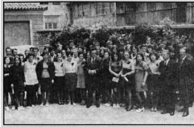
Iz kronike Gimnazije Tolmin: maturantje, letnik 1971