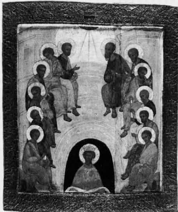
Ruska ikona, konec 15., začetek 16. stoletja. Spodaj Kristus Kralj, ob njem dvanajsteri apostoli ob prihodu Svetega Duha