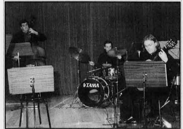
Med koncertom v Kulturnem centru 12. t.m.

Prvi je bil francoski skladatelj Claude Bolling (1930), ki je na osebni in izpoveden način sintetiziral in spojil klasično glasbeno govorico s sodobnejšo jazzovsko. Skupno sedem skladb iz Picnic suite je enkrat z igrivimi in virtuosističnimi, drugič z nežnimi in otožnimi toni (duo flavta-kitara) res prijetno presenetilo občinstvo; izvajalci so pokazali izredno sposobnost vzajemnega poslušanja, poleg te pa živo in radostno zaljubljenost v lepo glasbo,