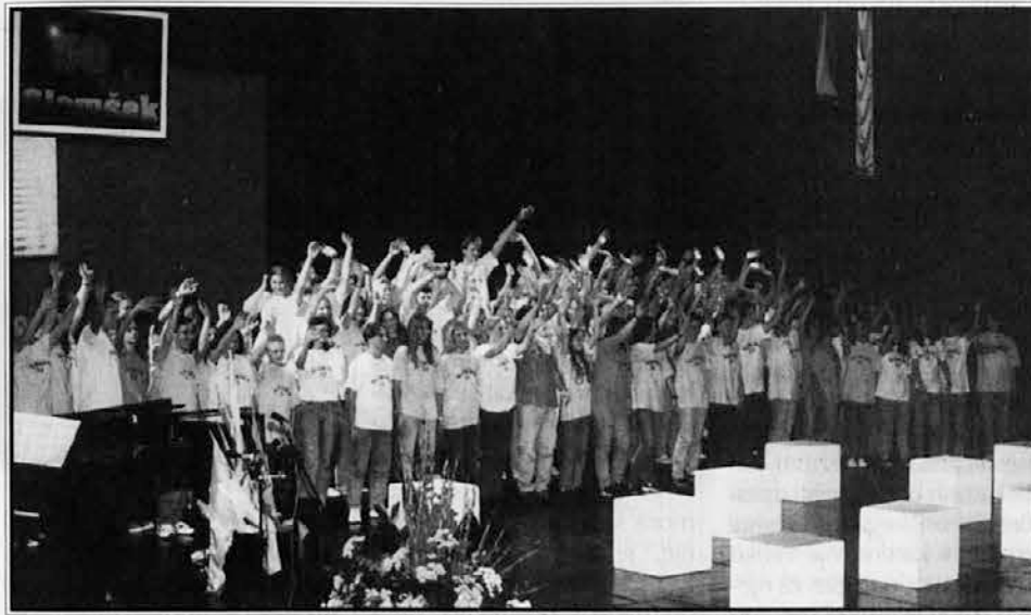
Velika dvorana tržaškega Kulturnega doma je bila za proslavo ob 50-letnici pedagoškega liceja Anton Martin Slomšek nabito polna. Spodaj platnica izrednega izvestja, ki je izšlo ob jubileju.

K mikrofonu je, kot že rečeno, najprej stopila predsednica zavodskega sveta, ki je pozdravsklenila z željo, da bi kakovost šole še naprej rasla. "V Trstu imamo samo to slovensko učiteljsko, zato je treba zanj še posebej skrbeti".