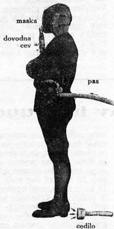
Naprava za dihanje s svežim zrakom

Mnogo boljši, zato pa tudi dražji, so aparati za dihanje s kisikom. Nosilec tega aparata je popolnoma nezavisen od zunanega zraka, naj si bo ta zastrupljen ali pa, da mu primanjkuje kisika. On diha s pomočjo priprave, ki mu sama od sebe (avtomatično) daje potreben kisik za dihanje. Človek pod masko rabi povprečno na uro okrog 100 litrov kisika.