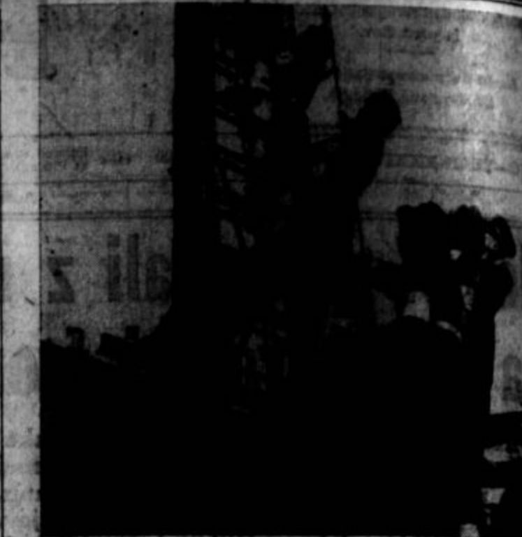
Vojna je polegla tudi ženice "in kuhinji." Skupina E. ...