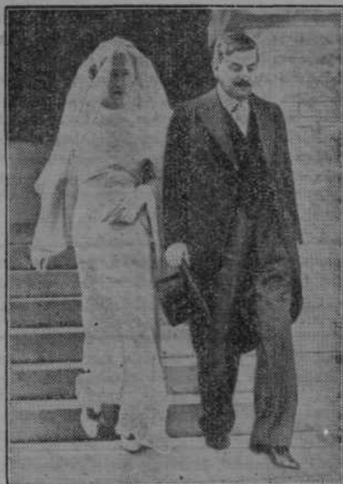
Francoski ministrski predsednik Laval pelje svojo hčerko po poroki iz cerkve.