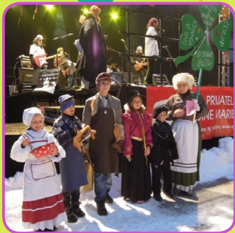
Prva nagrada za družinsko masko