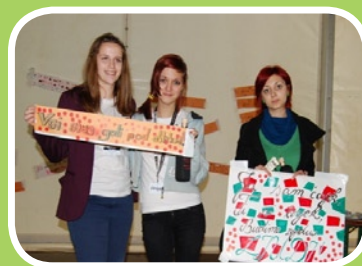
Zmagovalke natečaja za najboljši slogan

in bogastvo obmejnega sožitja«, Mariborčani smo izpeljali projekt »100 ljudi 100 čudi«, Varaždinci pa so za slovesni finale pripravili otroški glasbeni festival »Otroci pejejo«.