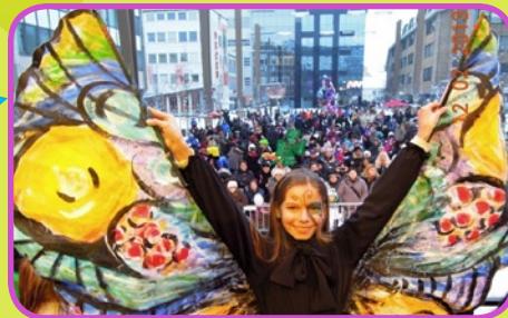
Prva nagrada za posamezno masko

Ogrela nas je glasbena skupina Karneval, čudili smo se »groznim« unikatnim Sokolskim maskam iz Novega mesta, manjkali pa niso niti kurenti.