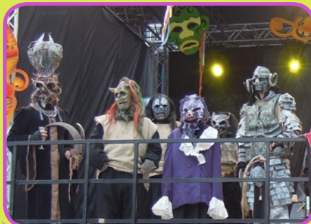
Unikatne Sokolske maske iz Novega mesta