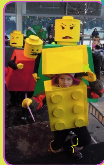
Prva nagrada za skupinsko masko