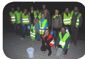
Prostovoljci - reševalci žab

Za sodelovanje je potrebna primerna obutev in obleka, odsevni jopič in baterijska svetilka (najbolje naglavna). Otroci se lahko akcije udeležijo le v spremstvu staršev ali druge odrasle osebe oz. s pisnim dovoljenjem staršev.