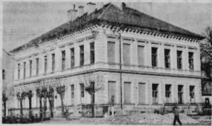
Vajenska šola v Ptuj

V zadnjih letih je podobor Obrtne zbornice Maribor v Ptuj našel izhod v skrbi za vodilni kader v obrti v samem Ptuj. Od leta 1958 dalje je uvedel šolo za kandidate za mojstre, ki traja 3 mesece s popoldanskim poukom. Dostaj je šola končala nad 50 kandidatov z območja podobora. S to šolo so končali kandidati za mojstrske izpite teoretični izpit, kar jim je tudi priznana in potrjeno s sprječevalom ob koncu šole. Z njimi je pridobila obrt izpopolnjen vodilni kader, ki se sedaj lažje znajde pri vsem odgovornem delu.