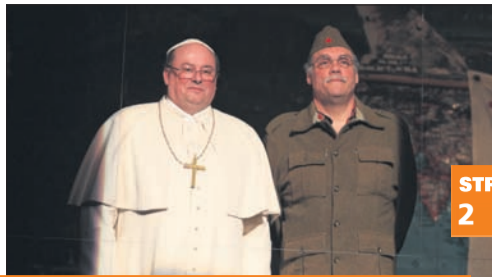
Celjski Dnevi komedije – zrcalo družbi!