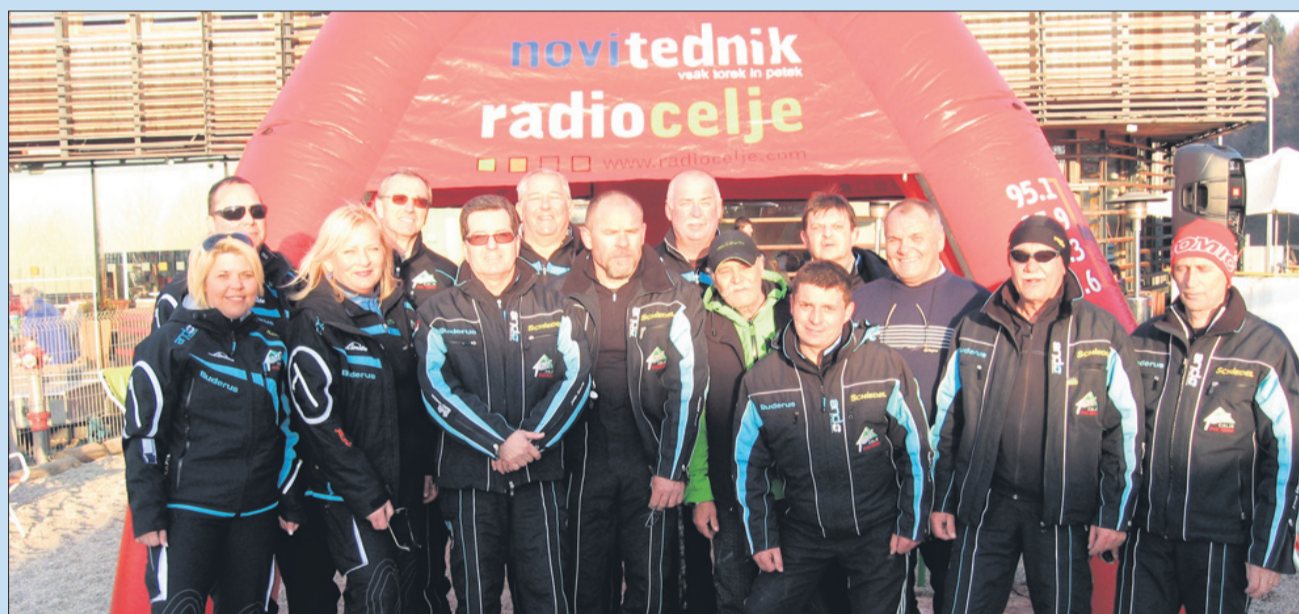
Organizatorjem je tudi letos, kljub nekoliko višjim temperaturam, uspelo izpeljati tekmo za pokal Celjske kočice. In uživati v zabavi z Radiem Celje.