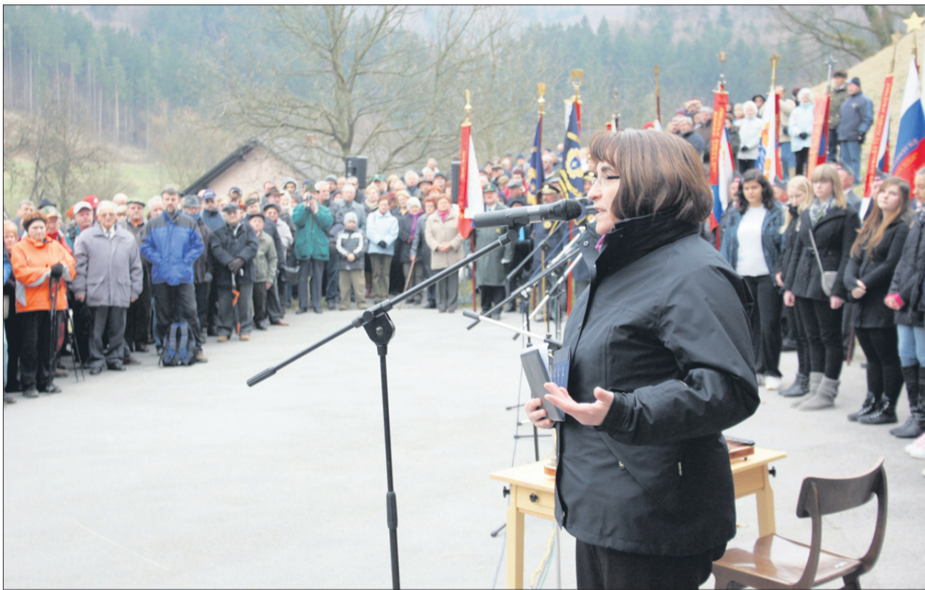
S svečanosti v počastitev 100 frankolovskih žrtev. Slavnostna govornica je bila obrambna ministrica, dr. Ljubica Jelusič