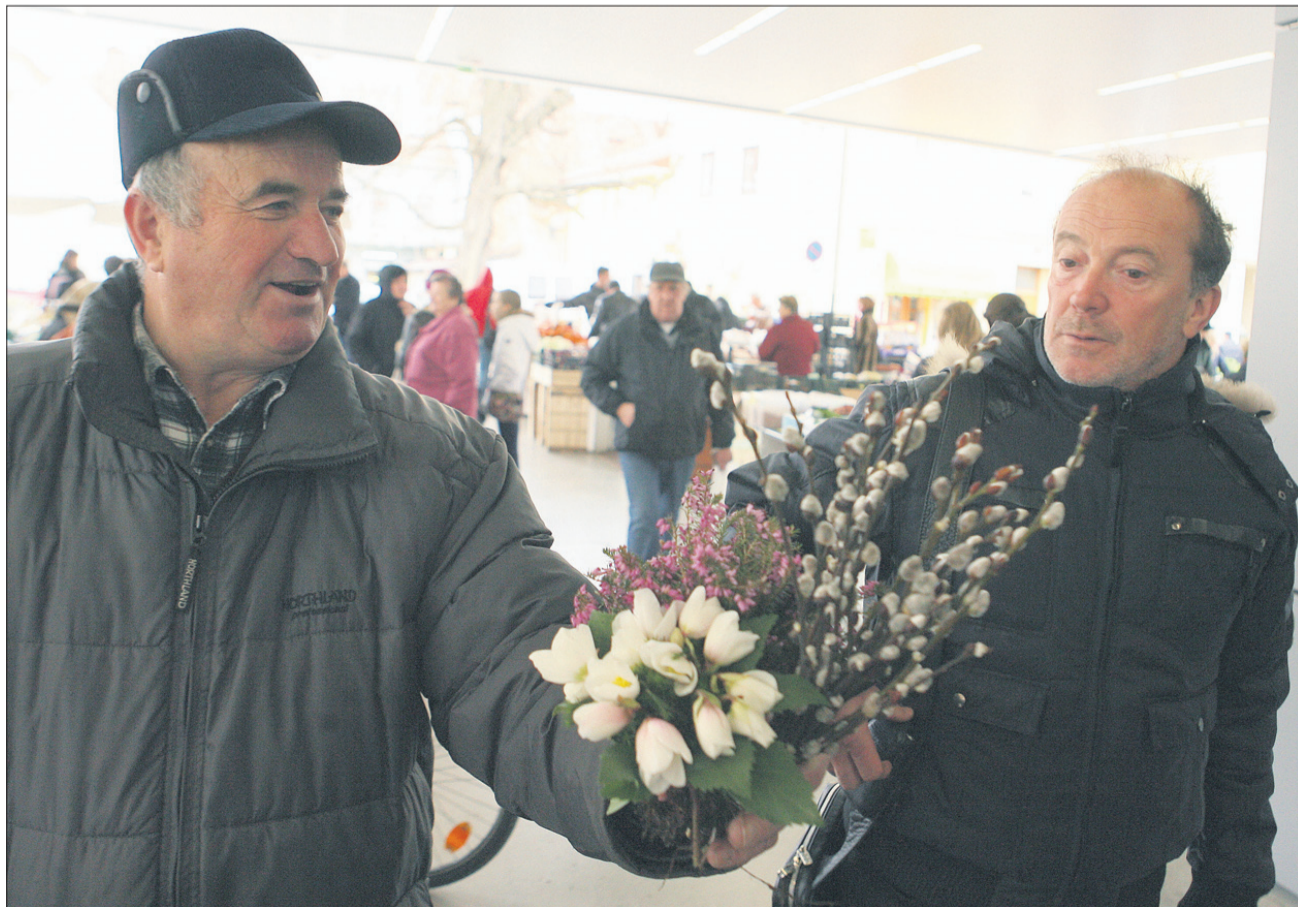
Hvala za rože