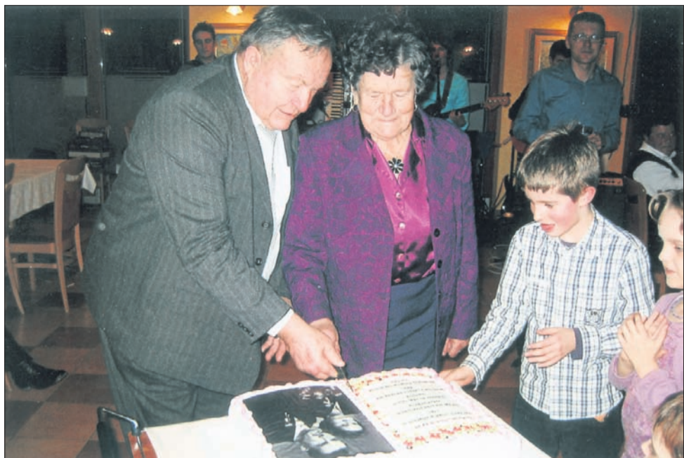
Zlatoporočenca sta razrezala slavnostno torto.