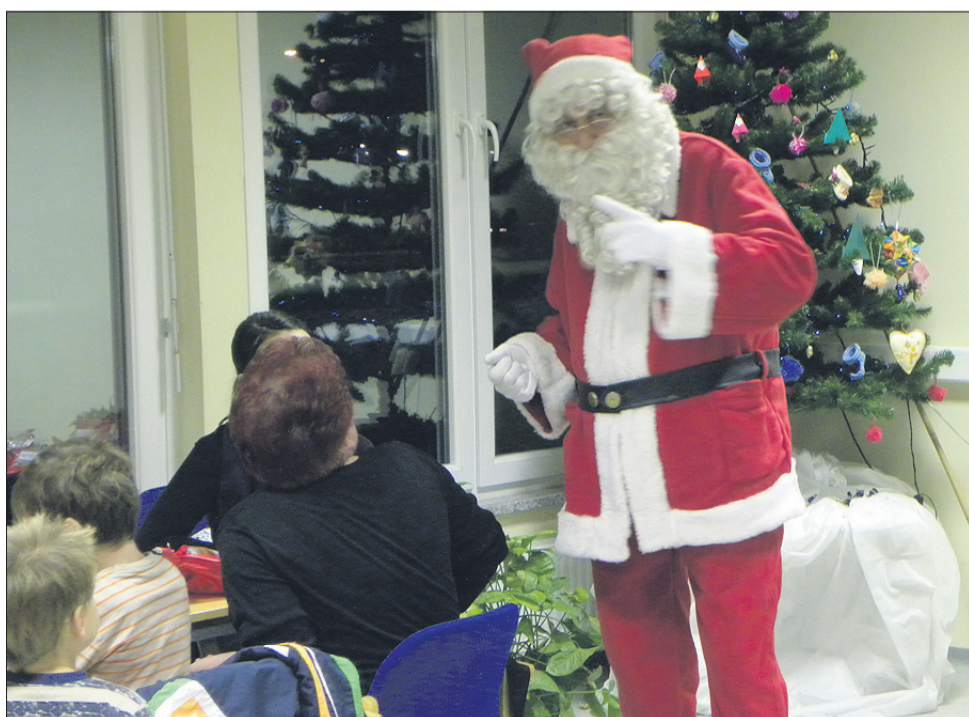
Obdaritev otrok v rejniških družinah