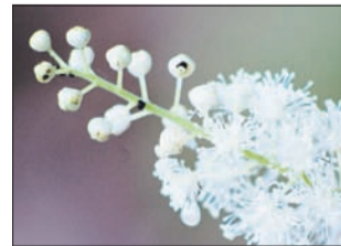
Grozdnata svetlika lajša težave v menopavzi.

Grozdnata svetlika (Cimicifuga racemosa), katere izvleček dobimo v lekarnah, velja za eno najbolj učinkovitih naravnih sredstev pri soočanju s težavami v menopavzi. Uravnava količino ženskih spolnih hormonov, blaži navale vročine ter lajša večino telesnih in duševnih simptomov, povezanih z menopavzo, na primer znojenje, zardevanje, motnje spanja, razdražljivost, brezvoljnost, depresijo. Vsaj tri mesece jemljemo vsak dan pol žličke izvlečka grozdnate svetlike.