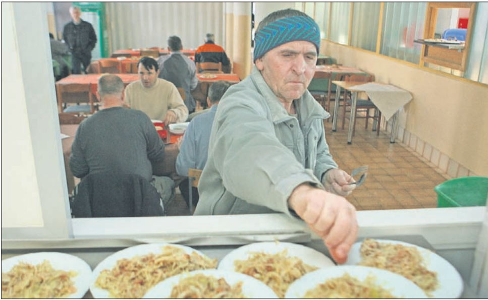
Dnevno v velenjski javni kuhinji skuhamo, postrežemo in razvozimo okoli 350 toplih obrokov. V kuhinji pomagata dva brezdomca, veliko je prostovoljnega dela, društvo Mali princ pa je lani zaposlilo tudi sedem nekdanjih Vegradovih delavcev. Prve obroke člani usklajene ekipe postrežejo ob 11. uri.