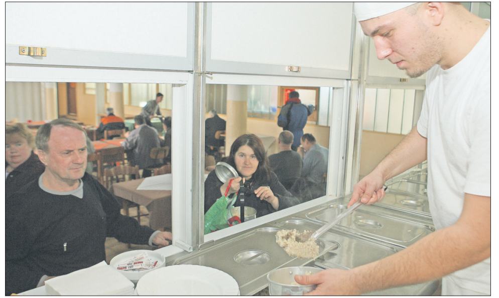
Brezplačni topli obroki so namenjeni pretežno delavcem Vegrada in Vemonta. Društvo Mali princ denar zagotovi iz naslova članarin, donacij in sponzorstev. Za socialno ogrožene občane pa obroke v javni kuhinji financira velenjska občina.