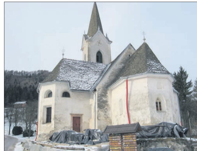
Sv. Anton ali sv. Jernej? Podružnična cerkev v Breznu, ki je streljaj od središča Vitanja, v vsakem primeru kliče po obnovi.

Običajno je seveda, da se cerkve imenujejo po svetnikih z glavnega oltarja, kar na Pohorju ni v navadi, saj je podobnih primerov kot v sedemsto let stari cerkvi v Breznu še nekaj. V župnijah s svetniki, ki godujejo pozimi, v starih časih večje cerkvene slovesnosti zaradi obilnega snega pozimi niso bile mogoče, zato so si pri patronacijah in poimenovanjih cerkva pomagali s svetniki s stranskih oltarjev, ki godujejo v vremensko prijaznejšem času.