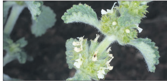
Črna meta pomaga proti neplodnosti.