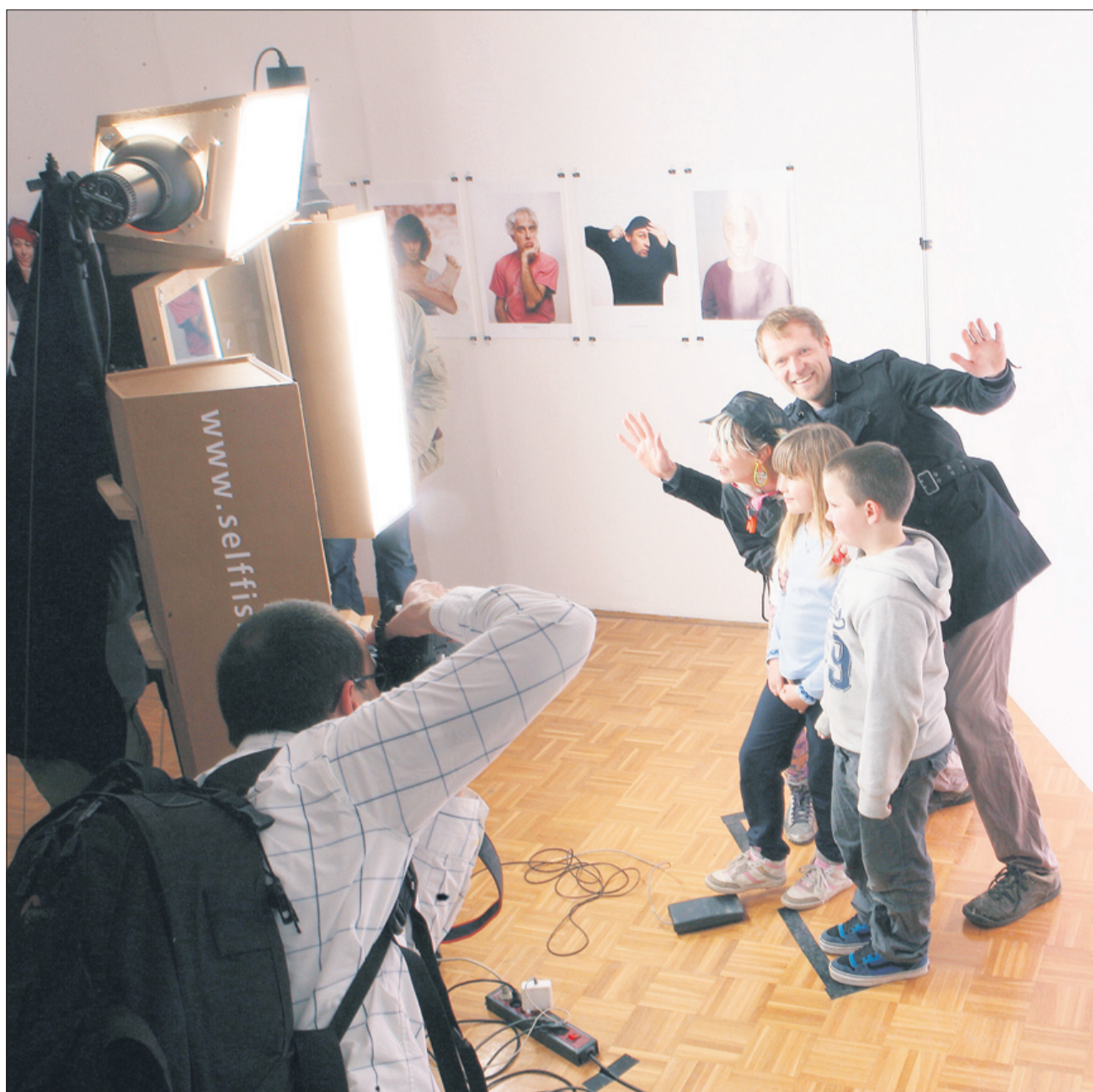
Del razstave je tudi prostor za snemanje avtoportretov s fotografsko kamero, kjer lahko vsak obiskovalec fotografira sebe v položaju, v katerem želi.