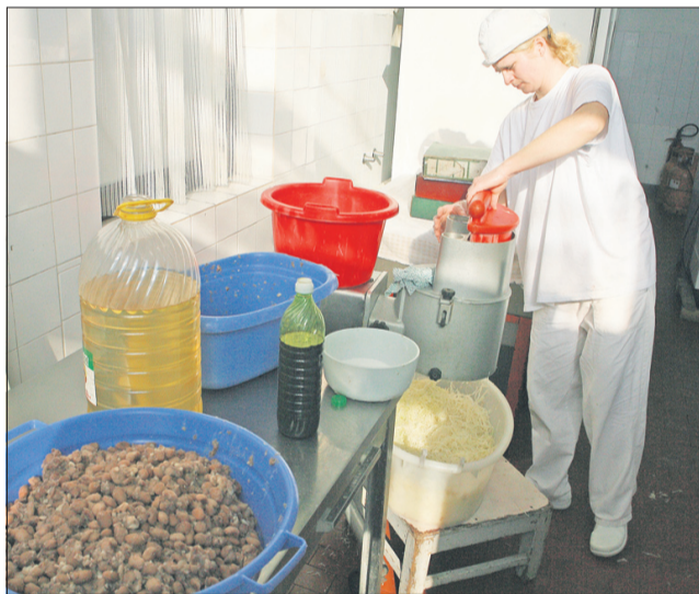
Mojca raje dela, kot bi govorila. Znajo pa njeni sodelavci povedati, da je delila usodo Vegradovih delavcev, saj tudi ona več mesecev ni prejela plače. Delala in kuhala pa je kljub temu. Če ne bi bilo nje, bi kuhinja zaprla vrata še preden jo je prevzelo društvo Mali princ.

»Res je, da so bili takšni prispevki na dnevnem redu slovenskih medijev kar lep čas. In javnost je dobila vtis, da ti ljudje dobesedno stradajo. Po-