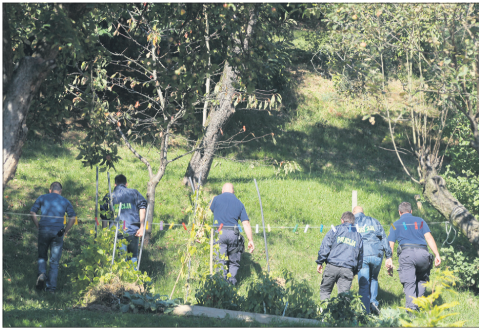
Takole so kriminalisti na prvi šolski dan prečesali Poplazov vrt. »Kot da sem najhujši kriminalc,« nam je dejal.

Po naših podatkih naj bi bomba eksplodirala ob 2.29