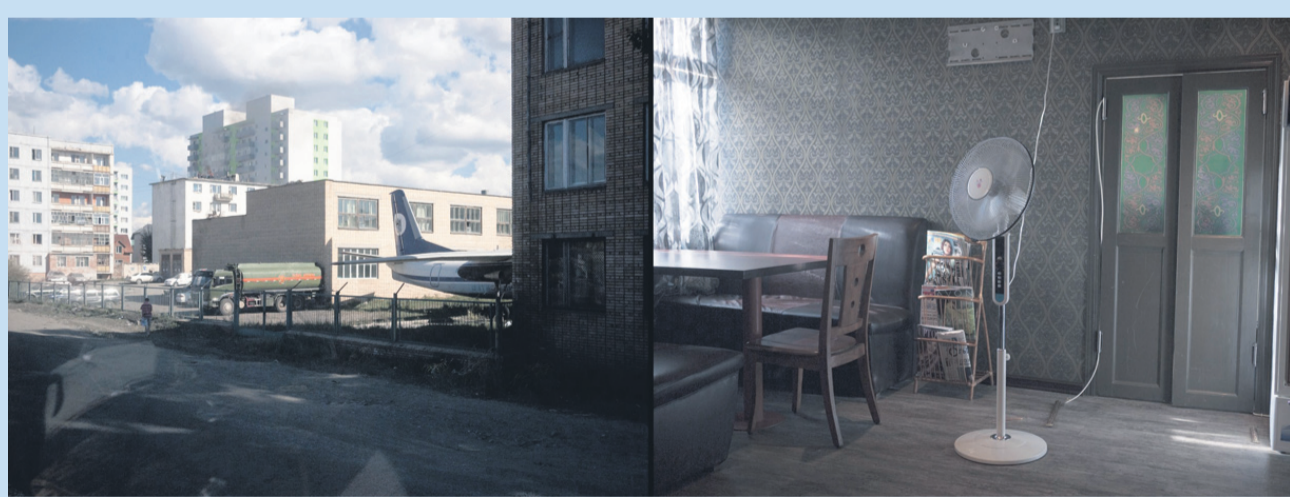
Fotografija iz opusa Tomaža Črneja It's all in your mind , narejena v Mongoliji v obliki diptiha, je bila v ožjem izboru za nagrado fotografija leta.

Alja Roš: »Čisto zadnja je bila Lepa služba nekega angleškega avtorja. Sicer imam rada predvsem romane, japonske na primer. Zelo veliko berem. Doma sem blizu knjižnice, pa še dosti časa imam. Mesečno preberem približno 30 knjig.«