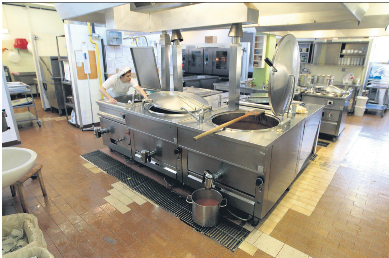
Občina je vendarle našla posluš in denar za celovito sanacijo šolske kuhinje v I. osnovni šoli Žalec. Na slabe razmere ni opozarjal le upravljavec kuhinje, zavod Petka, temveč se je oglasila tudi inšpekcija.