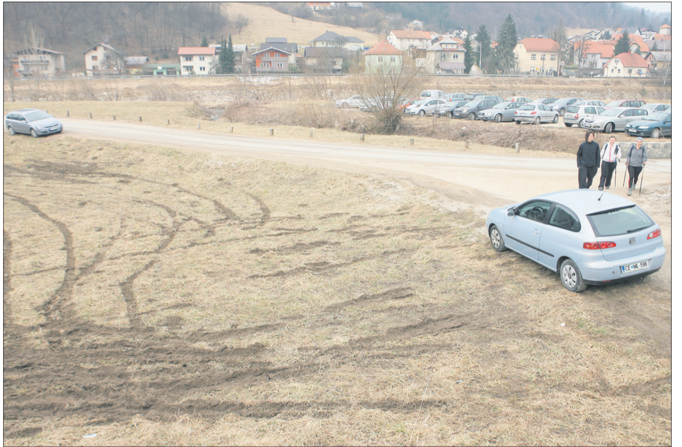
Travnik za »jeklne konjičke«?!

Sicer pa je vožnja v naravi tako ali tako prepovedana in tudi parkirati kar tako na travi ne smemo. »Problem je v tem, da se vsakdo želi pripeljati čim bližje. Parkirnih mest je na tistem območju ob koncih tedna dovolj. Parkirati je mogoče pred