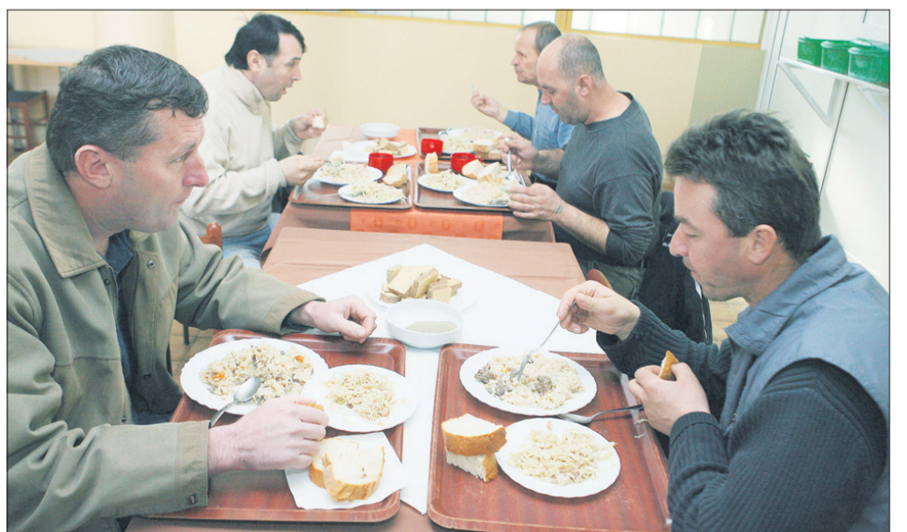
»Hrana je dobra. Nekateri so se res pritoževali, ampak vsem ne moreš ugoditi. Ob vsem, kar nas pesti, nas vsaj ne skrbi, ali bomo imeli kaj jesti,« smo slišali v času kosila v jedilnici velenjskega samskega doma.