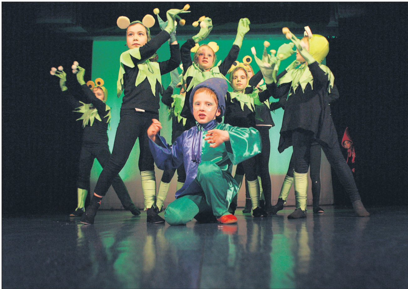
Škrat Sanjavec odpleše ples tudi z žabicami.