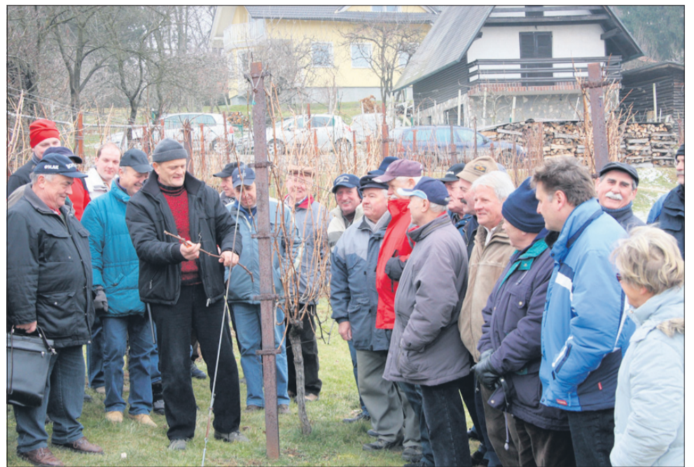
Udeleženci predavanja in prikaza rezi vinske trte