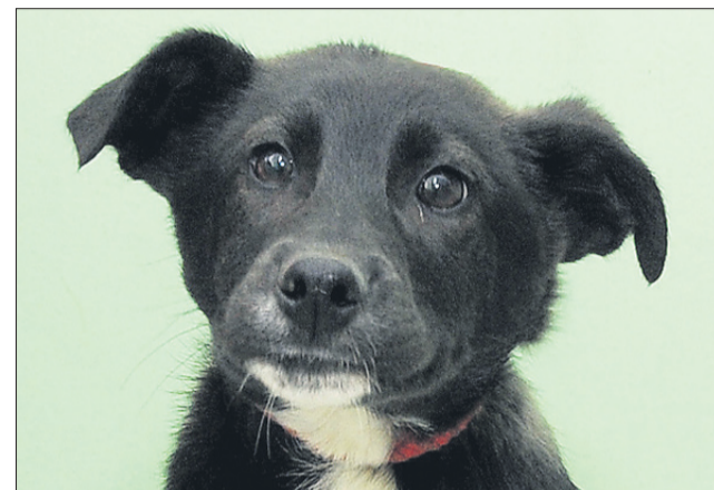
Rif je samec mešanec, star 4 mesece in ko odraste, bo srednje rasti. Našli so ga v Celju in išče nove skrbnike.

Uradne ure zavetišča Zonzani: od ponedeljka do petka od 8. do 16. ure; ogledi psov: od ponedeljka do petka od 12. do 16. ure. Sprehajanja po dogovoru in predhodni najavi po telefonu, od ponedeljka do petka od 12. do 16. ure. Telefon: 03/749-06-00; internetni naslov www.zonzani.si