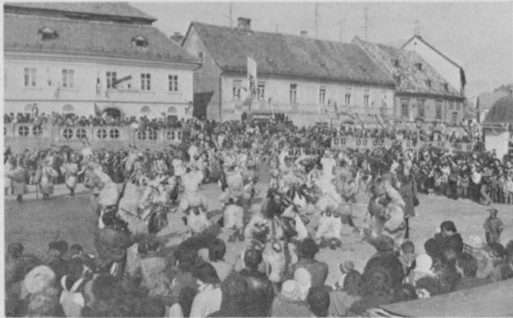
Kurenti so tudi tokrat sklenili dopoldanski del prireditve. Napovedali so, da bo zime kmalu konec.

Predstave poklicnih gledališč so postale že pravo razkošje za manjše kraje, saj jih po tako visokih cenah ne bo moč več uvrščati v programe abonmajskih predstav. Pa ne da bi kdo mislil, da igralci toliko zaslužijo, kar dve tretjini je prevoznih stroškov. Kljub temu pa pri Zvezi kulturnih organizacij v Ptujju računajo, da bodo ponujeni abonmajski program v celoti izpolnili. Že v ponedeljek, 9. marca, se bodo v Ptujju predstavili člani ljubljanskega Mestnega gledališča z delom sodobne ameriške dramatike To je prvi zahod. Dogovori pa tečejo še z gledališčem Glej za predstavo Sumertime, ki je bila na lanskem Boršnikovem srečanju proglašena za najboljšo. ms