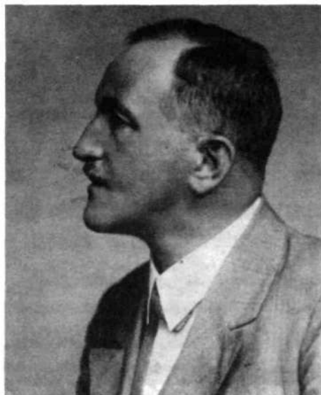
Skladatelj Oskar Dev (1868–1932) okrog leta 1929 (Maribor, Devova 60-letnica rojstva).

Oskar Dev se je rodil 2. decembra 1868 v Planini pri Rakeku 1 (srez Logatec, ljubljanska oblast) v pravniški družini in z glasbo navdahnjenem