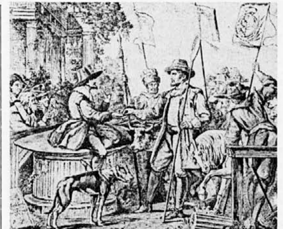
Ustoličevanje Koroških vojvod (iz: Die österr. Monarchie im Wort und Bild, Kärnten und Krain, Dunaj 1891)

Značilno za Ketlaško kulturo je razvito cerkveno stavbarstvo s pleteninasto ornamentiko, gradnja utrjenih gradišč, močno razvito lončarstvo ter okrasna umetnost, ki se kaže posebno na uhanih in brošah iz grobov. Na teh uhanih in brošah se pojavljajo značilni simboli: rozete, dre-