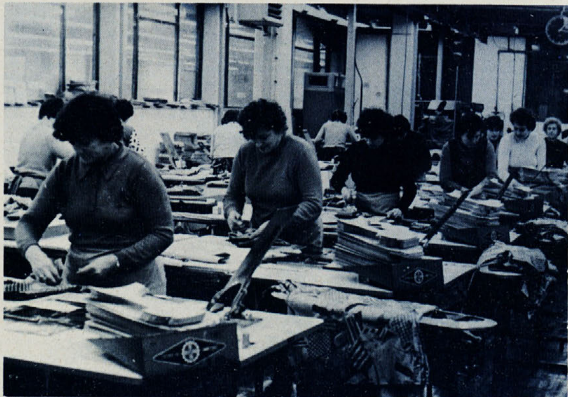
Marsikatera delavka iz tozda Ločne se še spominja težkih delovnih pogojev v starih prostorih. Letos poleti mineva 20 let od preselitve na današnje lokacije. Izgradnja sedanjih prostorov je bila velika zmaga, ki je dala nov polet in predvsem nove moči za doseg boljših rezultatov in razvoj Laboda.

V tozdu Libna se že dlje ubadajo z visokim odstotkom bolniških izostankov. Lani na primer je znašal 13,23 odst., letos v šestih mesecih 16,06 odst., kar je glede na planirano število, ki znaša 12 odstotkov, zaskrbljujoče. Težave niso nove in tudi prizadevanja za zmanjšanje bolniške ne. Tesno so povezani z zdravstvenim domom, s katerim sodeluje tudi nova ustanovljena komisija za nadzor nad bolniškimi. Sklep o formiranju te so v Libni sprejeli na zboru delavcev, sestavljajo pa jo poslovna sekretarka, članica samoupravne delavske kontrole in predstavnica brigade, v kateri je bolni-