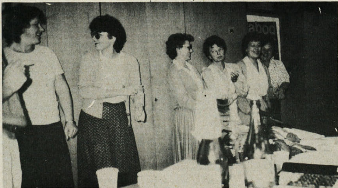
Po zaključenem delu nekoliko bolj sproščeno vzdušje med delavkami na obračunih osebnih dohodkov.

Računalniška obdelava OD je prinesla tako vsem nam veliko novosti in ugodnosti. Kuverta je zelo pregledna in nam da zares bistvene informacije, za same delavce na področju obračuna OD pa je novost prinesla veliko manj pisanja in večjo usklajenost ter predvsem manjše možnosti za napake.