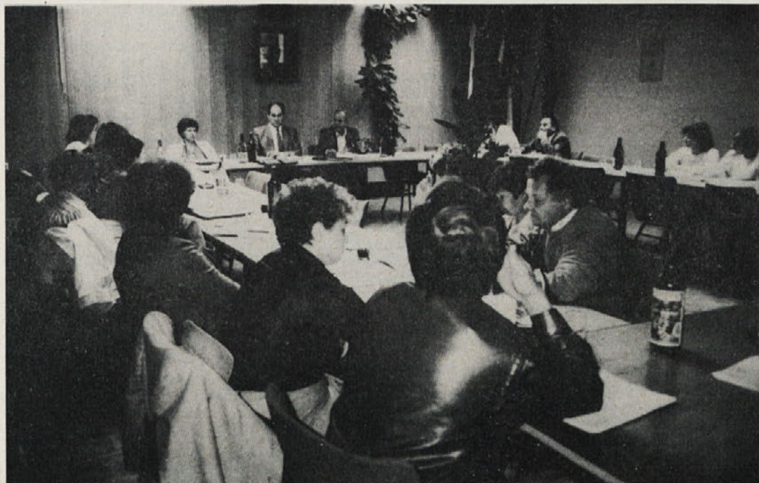
2. seja delavskega sveta delovne organizacije je bila v Libni.