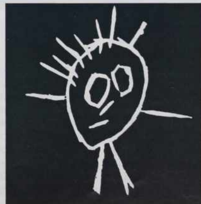
OTROCI ODRASLIM 1996/1997