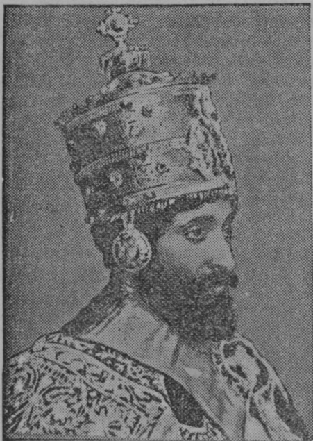
Abesinski cesar Hajle Selasje I.