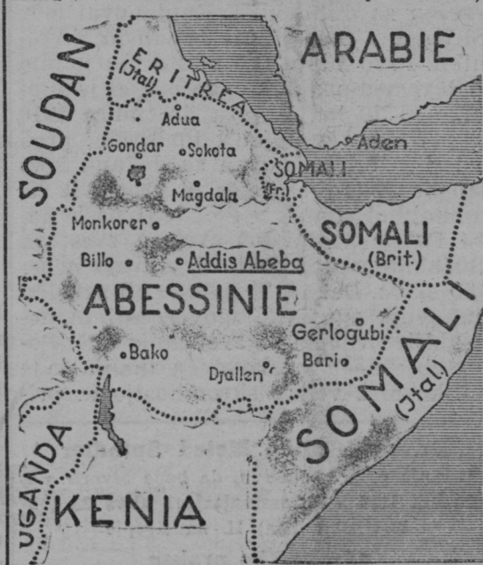
Zemljevid Abesinije, s katero hoče začeti vojno Italija.

Razlog? Abesinija je edina neodvisna država v Afriki, vse druge so pod nadoblastjo evropskih kolonialnih držav. Leži v vzhodnem delu srednje Afrike,