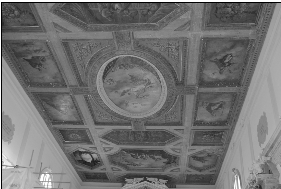
Sl. 4: Župnijska cerkev sv. Jurija, Piran, pogled na strop dvoranske ladje (foto: V. Prohinar, 2008).