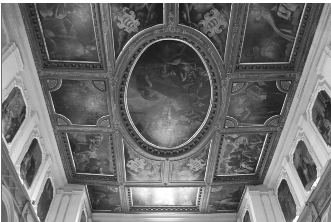
Sl. 1: Cerkev S. Francesco di Paola, Castello, Benetke. Dekorativni strop ladje, pred 1600. Fig. 1: The church of St. Francesco di Paola, Venice. Decorative ceiling of the aisle before the year 1600.

Zasnova lesenega ogrodja stropa v cerkvi S. Francesco di Paola se v primerjavi z izrazitim razkošjem in razgibanostjo v izdelavi lesenega ogrodja stropa v ladji cerkve San Sebastiano v Dorsoduru izraža z enostavnimi, čistimi elegantnimi formami, ki učinkujejo veliko bolj umirjeno in diskretno, zato je s tega vidika primerjava s piranskim stropom ustrezna. Strop v cerkvi San Francesco di Paola je bil dokončan pred 1600, v leta med 1592 in 1609, torej v isto časovno obdobje, datiramo tudi neposredni vzor piranskemu stropu, dekorativni strop v cerkvi San Domenico, ki je do uničenja stala v bližini frančiškanske cerkve v mestnem predelu Castello. S piranskim stropom je primerljiv tudi način rezbarske izdelave posameznih dekorativnih detajlov okvirjev in vmesnih polj ter detajl segmentnih četrtnskih polj, ki dopolnjujejo vogalne slike in sredinski sliki daljših stranic ob ovalu in posnemajo motiv četrtnike rozete, ki se zgleduje po značilnem renesančnem školjčnem motivu. Osrednje ovalno polje in vzdolžno pravokotna polja obroblja okvir s 'cofkastim' rezbarskim motivom, ki ga najdemo tudi na osrednjem ovalu piranskega stropa.