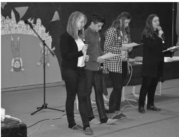
Slika 5: Povzemanje