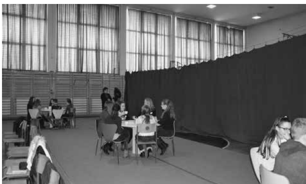
Slika 6: Skupine, ki se nenehno menjavajo

Zelo uporabna je tudi kot dejavnost pri delu z nadarjenimi učenci.