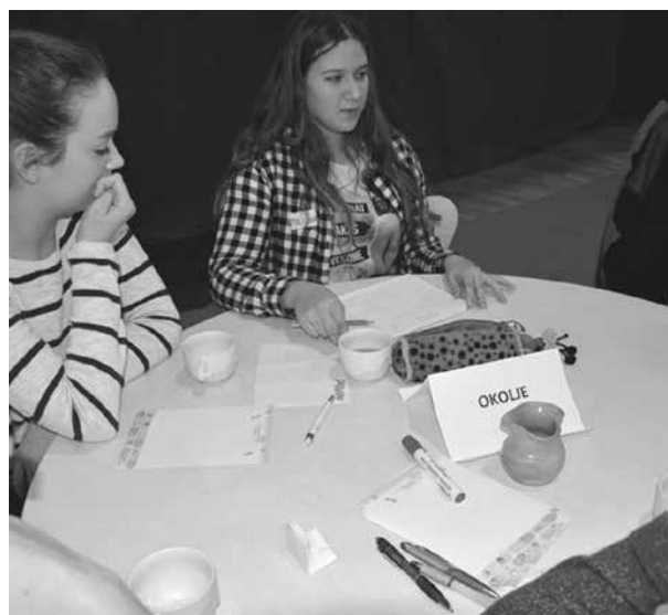
Slika 3: Moderatorka z razpravljavci

Na koncu je vsak moderator povzel dogajanje pri posameznem omizju in občinstvu predstavil številne odlične predloge reševanja izzivov, ki so jih podali učenci razpravljavci.