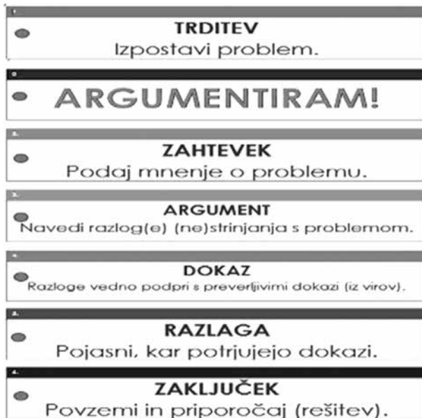
Slika 2: Pripomoček za razvijanje argumentiranja

Raziskovanje nam je prineslo celo vrsto spoznanj.