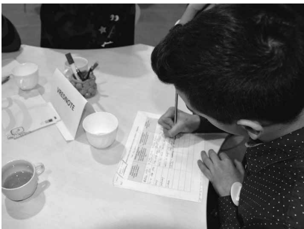
Slika 4: Moderatorjev zapis