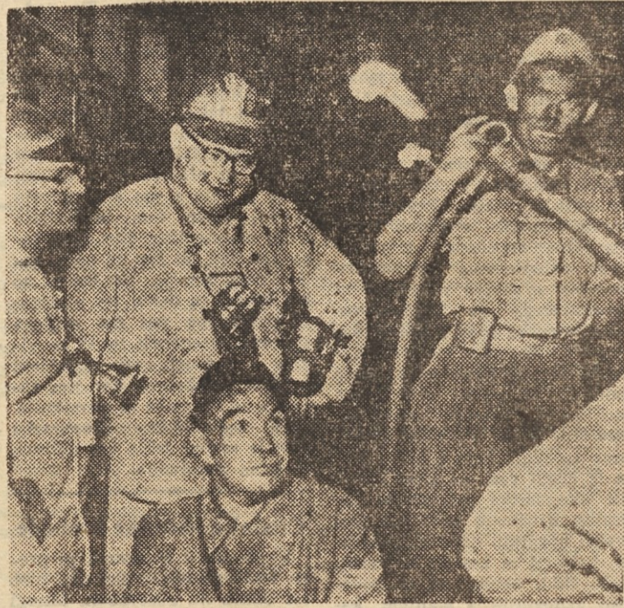
Erich Ollenhauer, vodja nemških socialnih demokratov med westfalskimi rudarji.

Južnokorejska opozicijska Demokratska stranka je na svojem nedavnem kongresu obtožila predsednika Sing Man Rija, češ da je v njegovi vladi polno korupcije. V vladi so le korupcionalni, ki izkoriščajo svoje položaje za kapičenje velikih dobičkov. Demokratska stranka zahteva, naj se vlada ne vmešuje v splošne volitve, ki bi morale biti prihodnje pomlad. V sedanjem južnokorejskem parlamentu je 132 poslancev vladne Liberalne stranke, 43 poslancev Demokratske stranke in 27 neodvisnih.