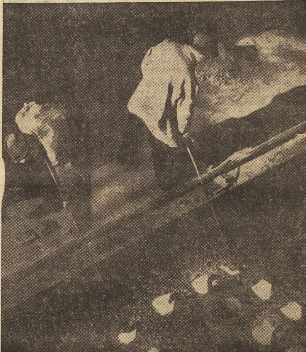
Petletni plan... Načrt za gospodarjenje... Noben zakon, nobena uredba, noben načrt ne bo pospešil razvoja našega gospodarstva, ne bo izboljšal življenjske ravni nas vseh, če se ne bomo vsi zavzeli za to z vso resnostjo, uresničevali to, kar smo zapisali, za kar smo glasovali, za kar smo vsi.

Zato se spominjamo ob 15-letnem jubileju rajstva časopisa »Delavske enotnosti« še predvsem vseh tistih, ki so prispevali k utrditvi enotnosti delavskega razreda in vseh sodelavcev našega glasila, ki so s svojim sodelovanjem doprinesli in še doprinašajo k tej enotnosti, k socialistični graditvi, k lepšemu, bogatejšemu in polnejšemu življenju vseh delovnih ljudi in delavskega razreda.