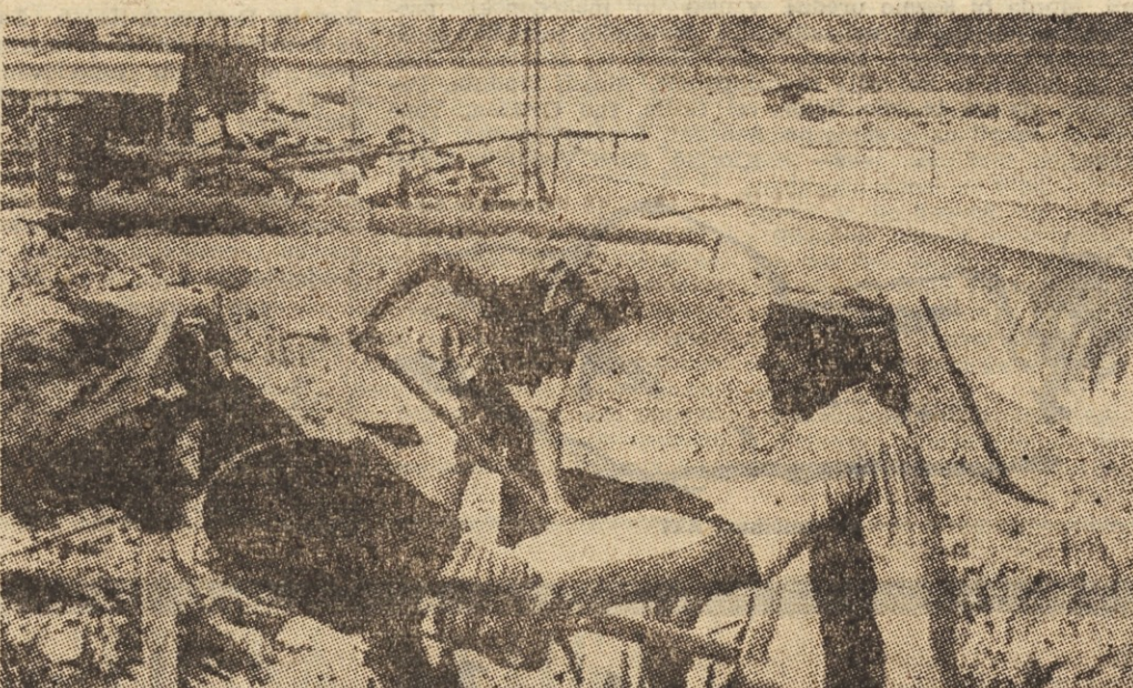
V arabskem svetu je še polno ostankov starega, že preživete sistema in tuje vpliva. Je v Ljubljani izjavil Michel Aflak, vodja delegacije Socialistične stranke arabskega preporeda, »zato moramo najprej prebuditi nacionalno zavest, nato pa okreptiti socialni boj.« Arabski delavci ob naftovodu v Adenu.

To je bila po vojni najbolj prečijša zmaga socialne demokracije v Hamburgu.