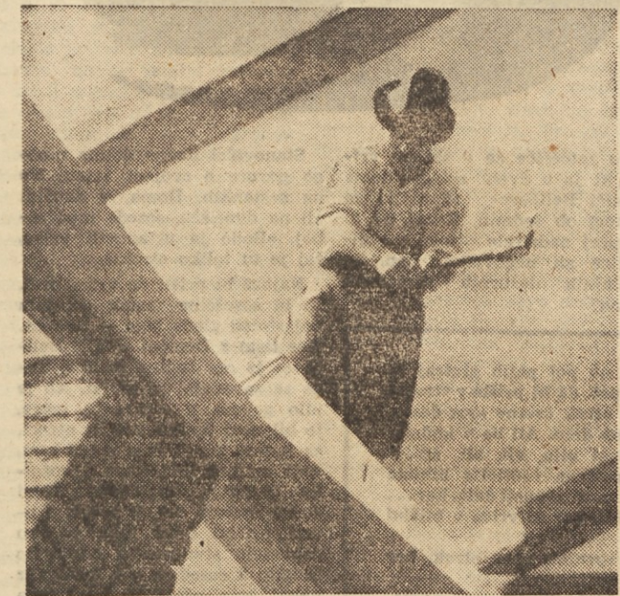
Stanovanj je premalo. Tudi tovarne bomo še gradili, vendar za sedaj gradimo še predrago in prepočasno. Zato je predvideno v petletnem planu, da bi morali gradbeništvo modernizirati, ga še hitreje razvijati, ga usposobiti, da bomo gradili hitreje in bolj poceni.