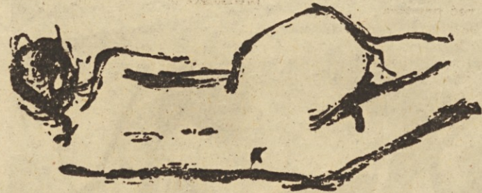
B. Omčikus: Akt

V čitalnici je na razpolago preko 40 dnevnikov, tednikov in mesečnikov, po katerih bralci radi segajo. Čitalniški prostori pa postajajo že pretesni. Morda bi kazalo urediti boljše razsvetljavo in nabaviti po nekaj izvodov več časopisov, za katere je največje zanimanje, da ne bi bilo treba predolgo čakati na posamezne izvide.