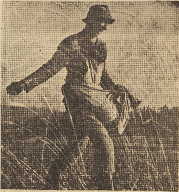
Sejalteve sanje. Tako je imenoval Leopold Fischer, avstrijski fotograf, tale svoj posnetek. Za nas to ne smejo biti sanje, tako smo sklenili. Preveč denarja izdamo za žito, preveč, ker ga še premalo pridelamo.