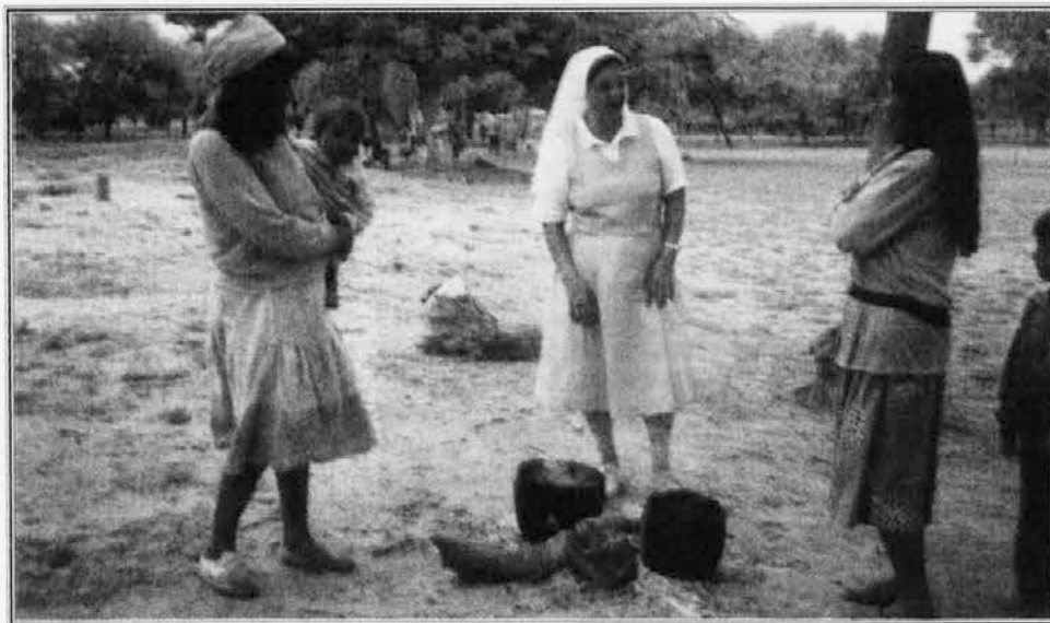
Žalostno je, če v loncu vre samo voda.

Še enkrat en velik Bog povrni vsem za vse molitve, žrtve in bogate darove.